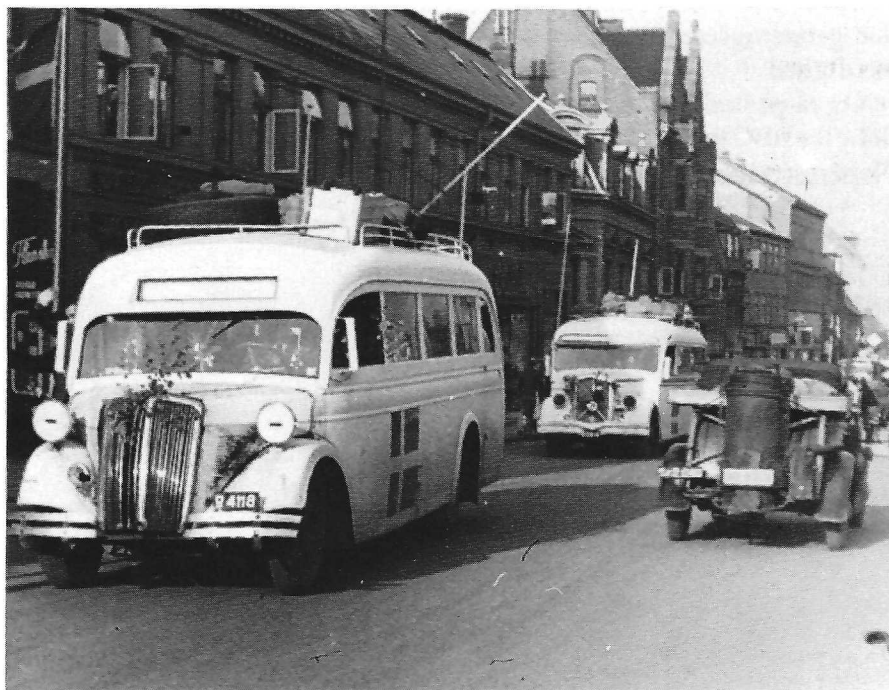
De hvide busser kører gennem Roskilde.

I løbet af april måned stod det klart for enhver, at Befrielsen var nært forestående.