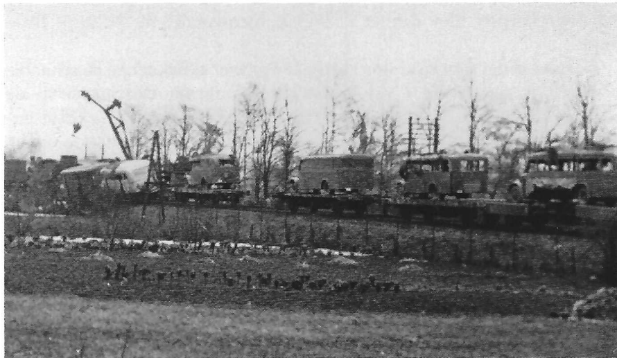
Den saboterede togstamme ved Røde Port i februar 1945.