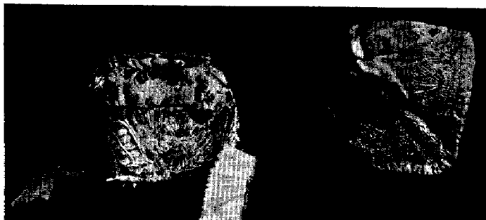
Daabshuerne svarede til Kristentøjet; de er som dette udstyrede med Guld- og Sølvborter, haandbroderede Blomster, Rosetter og Silkebaand.

skulde mangle Mad eller Penge. Men det maatte ikke glemmes, at Barnet ogsaa efter Kirkegangen skulde lægges i Vuggen og der sove en Søvn med hele Stadsen paa. Disse to Genstande, Brød og Sølvskilling, gemte Barnets Forældre som en Skat, og naar Barnet blev voksent, fik det den udleveret som sin Ejendom med en Paamindelse fra Forældrene om at gemme dem; thi saa længe det havde dem i Eje, vilde det ikke komme til at savne de to tidligere nævnte Goder. Der findes endnu ældre Folk i vore Dage, der er døbt omkring 1850, og som troligt den Dag i Dag gemmer deres Sølvskilling og Brød fra deres Daabsdag. Mindre bemidlede Folk har maaske i de pengeknappe Tider brugt Sølvskillingen, inden Børnene er blevet voksne, og af den gyldige Grund været fri for at give dem den i Ary.