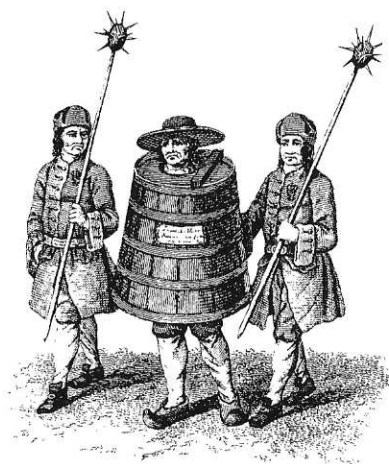
Straffen for opsætsighed under hoveri kunne i visse tilfælde være, at misdæderen skulle bære den spanske kappe gennem byens gader. Her ses en bonde iført spansk kappe eskorteret af to vægere under en ydmygende tur gennem Københavns gader.