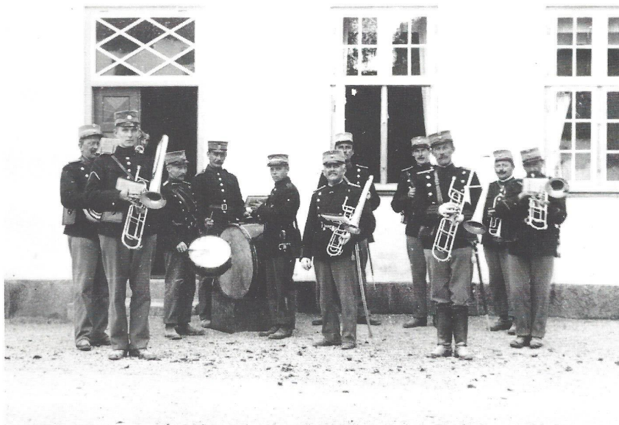
I kantonement på Svenstrup Gods ca. 1915.