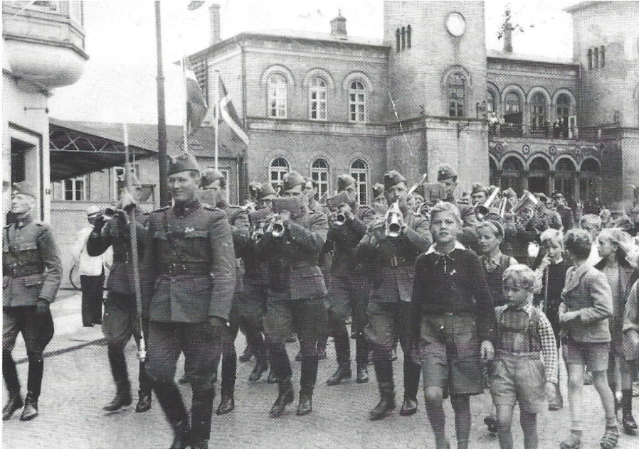
4. Regiments musikkorps marcherer fra Hestetorvet.

Musikkorpset forblev i Holbæk, men overflyttedes siden til Høvelte som Danske Livregiments Musikkorps (1. Regiment).