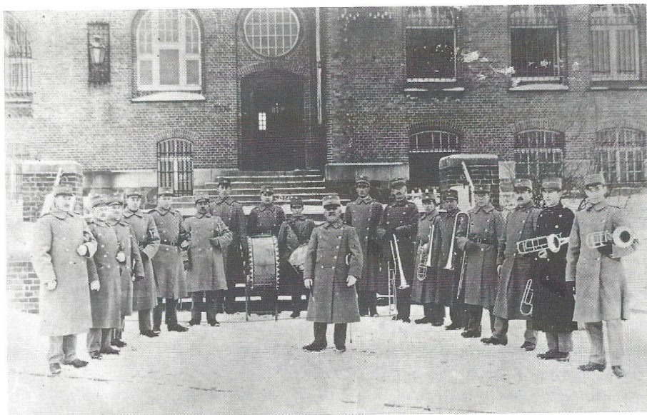
8. Regiments musikkorps foran Sønderborg kaserne ca. 1921.