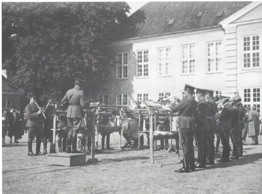
Middagskoncert i Palægården ca. 1930.