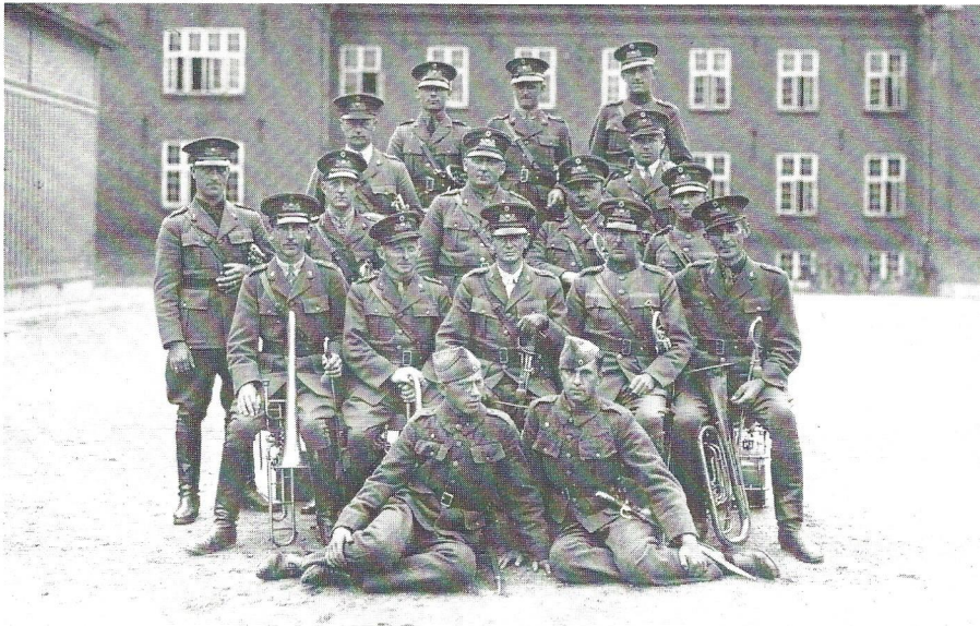
Musikkorpset i Roskilde kasernegård sommeren 1932..