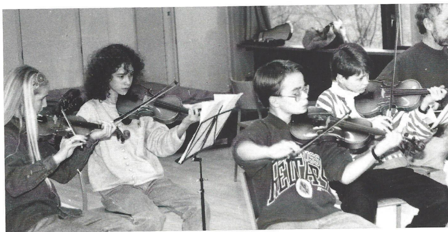
Fra et af Kammerorkestrets første år.

Som det tidligere er blevet nævnt, var idégrundlaget bag al denne aktivitet undervisningsvejledningens bemærkning om dannelsen af skoleorkestre, så arbejdet med at starte forskellige former for sammenspil pressede på, både