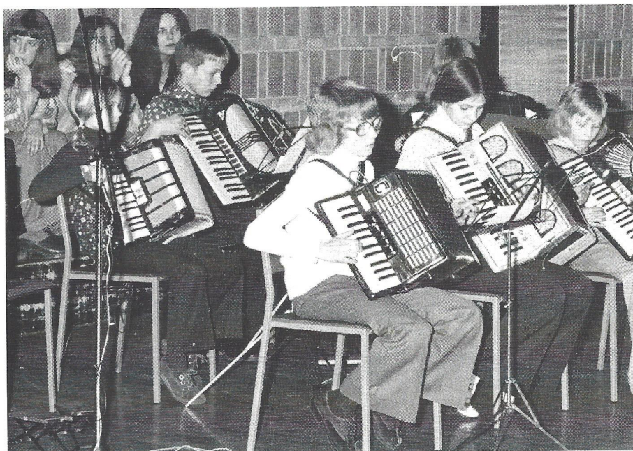
Harmonikaen var meget populær i folkemusikkens glansperiode. siden har tilmeldingen på harmonika fundet et mere normalt leje.

samtlig kommunale skoler, og da børnetallet i disse år voksede, øgedes også udgifterne tilsvarende. Det er imidlertid værd at bemærke, at gratisordningen bestod op gennem 80'erne trods »kartoffelkure« og anden ministeriel opfindsomhed. En medvirkende årsag til kommende ændringer kan have været, at Danmarks Sanglærerforening, senere kaldet Folkeskolens Musiklærerforening, efterhånden fik en mere og mere reserveret holdning til, hvorvidt en sådan musikundervisning hørte hjemme i Folkeskolen.