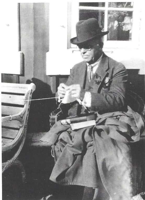
Fig. 3. Carl Nielsen led i de sidste år af en hjertelidelse, der tvang ham til at holde sig i ro. Han tilbragte derfor ofte tiden med at strikke!.

Det er almindelig kendt at Carl Nielsen var meget åben over for kollegers forslag til mindre ændringer i hans værker. Så meget desto mere bemærkelsesværdigt er det derfor at konstatere, hvordan han i dette tilfælde ikke var i tvivl om bæredygtigheden af sine egne ideer.