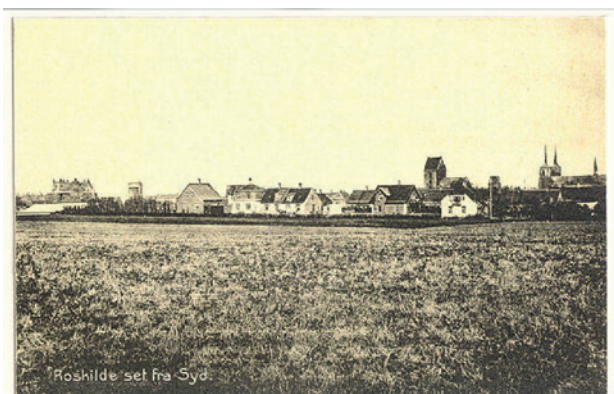
Foto fra 1907 viser i forgrunden det nye villakvarter ved Knudsvej syd for banen. Det var det område, der hed Frederiksberg.