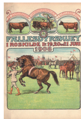
Program for dyrskuefesten den 20. juni 1908 ved Fællesdyrskuet i Roskilde den 19., 20. og 21. juni 1908. Arrangør var De Samvirkende Landboforeninger i Sjællands Stift.

Efter det vellykkede jubilæumsdyrskue holdt man pause et par år. Det næste fællesdyrskue holdtes i 1908 i Roskilde, der før skuet havde givet tilsagn om at ville betale halvdelen