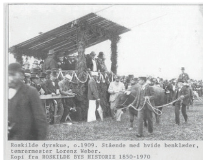
Roskilde Dyrskue i 1909 med bedømmelse af køæg.

I årene fra 1916 til 1924 blev fællesdyrskuerne afholdt på skift mellem en række sjællandske byer, bl.a. Roskilde. Man var imidlertid begyndt at stille spørgsmål ved at fortsætte med de såkaldte vandreskuer, hvor fællesskuet skiftede fra by til by. I landbruget var man ved at nå frem til en erkendelse af, at vandreskuer i større eller mindre grad prægedes af den egn, hvor fællesdyrskuet blev afholdt. Det var derfor ønskeligt at få fællesdyrskuet lagt fast på et centralt sted på Sjælland.