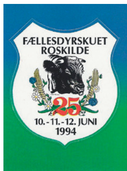
Logo for Roskilde Dyrskue i jubilæums- året 1994.

vide os forståelse, støtte og opmuntring, og at man vil betragte og bedømme landbrugets situation realistisk," sagde han. (RD 27.5.1968)