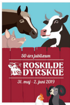
Plakat for Roskilde Dyrskue i 50 års jubilæumsåret 2019.

1882 var landbrugets redskaber og maskiner ret primitive, men siden omkring 1900 blev udstilling af landbrugets redskaber og maskiner snart et naturligt led i fællesdyrskuernes aktiviteter.