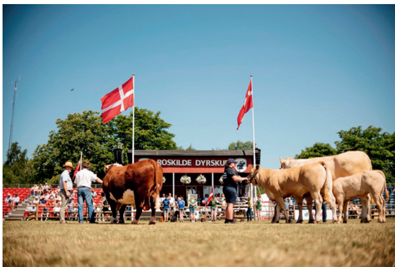
Ud over at være en fremvisning af landbrugets dyr har dyrskuerne den funktion at præsentere landbrugets mange produkter.

Siden åbningen i 1969 skete der en iøjnefaldende udvikling i præsentationen af fødevarer fra landbruget. Dyrskuerne er i stigende grad blevet et spejl af den udvikling, forbrugere og madvanerne siden har undergået.