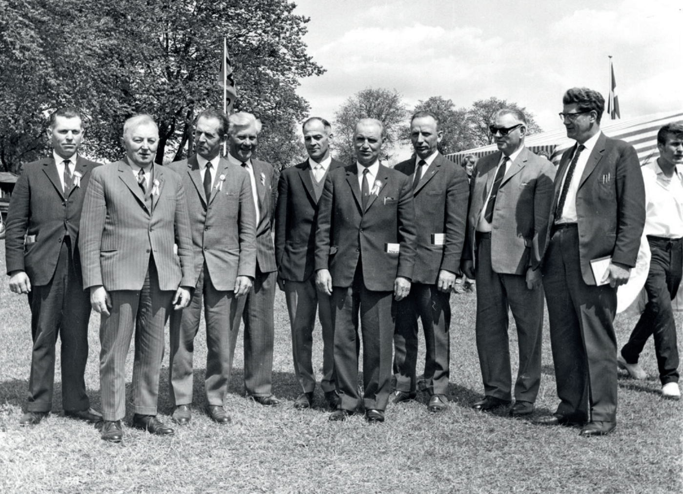
Ledelsen for Fællesdyrskuet i Roskilde 1969-70.

ver og udgifter kommunen skulle stå for. Roskilde kommune bekostede de nødvendige tekniske installationer som el, vand og kloak, ligesom kommunen anlagde vejene på dyrskuepladsen og sørgede for beplantningen på pladsen.