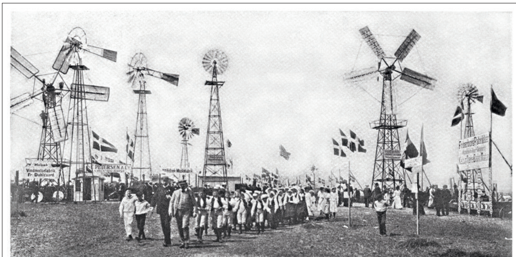
De svenske Skolebørn paa Dyrskuepladsen. Dyrskuet i Roskilde

Roskilde havde før 1969 en lang tradition som dyrskueby. I byen blev der arrangeret et lokalt dyrskue, som gennem mange år fandt sted på den gamle dyrskueplads på Køgevej, men de store fællesdyrskuer havde i årtier været arrangeret