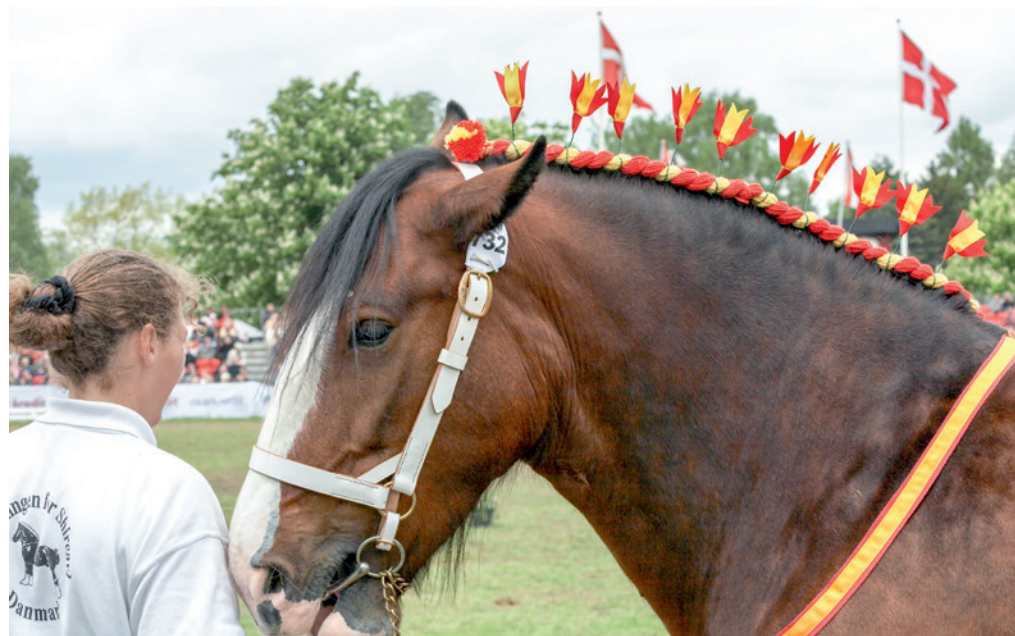
Dyrskuerne er et møde mellem land og by, hvor fremvisningen af de udstillede dyr er blevet mere publikumsvenlig. Fra dyrskuet 2005.

Ud over at være en fremvisning af landbrugets dyr har dyrskuerne haft den funktion at præsentere landbrugets mange produkter. Det at gå på dyrskue har også givet mulighed for at blive inspireret til familiens hjemlige madlavning, og derfor har dyrskuerne lagt en stor indsats i at uddele poser med opskrifter og andet reklamemateriale til de besøgende.