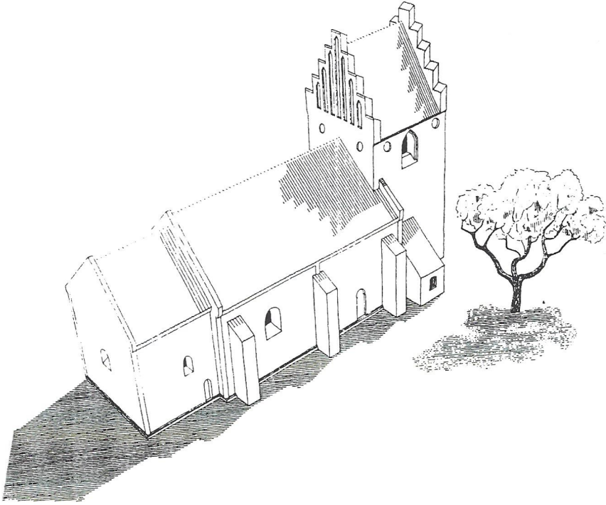
Fig. 1. Sankt Jørgensbjerg kirke konstrueret fugleperspektiv efter opmålinger fra 1942. Tegnet 1960-61 af Holger Schmidt. Nationalmuseet