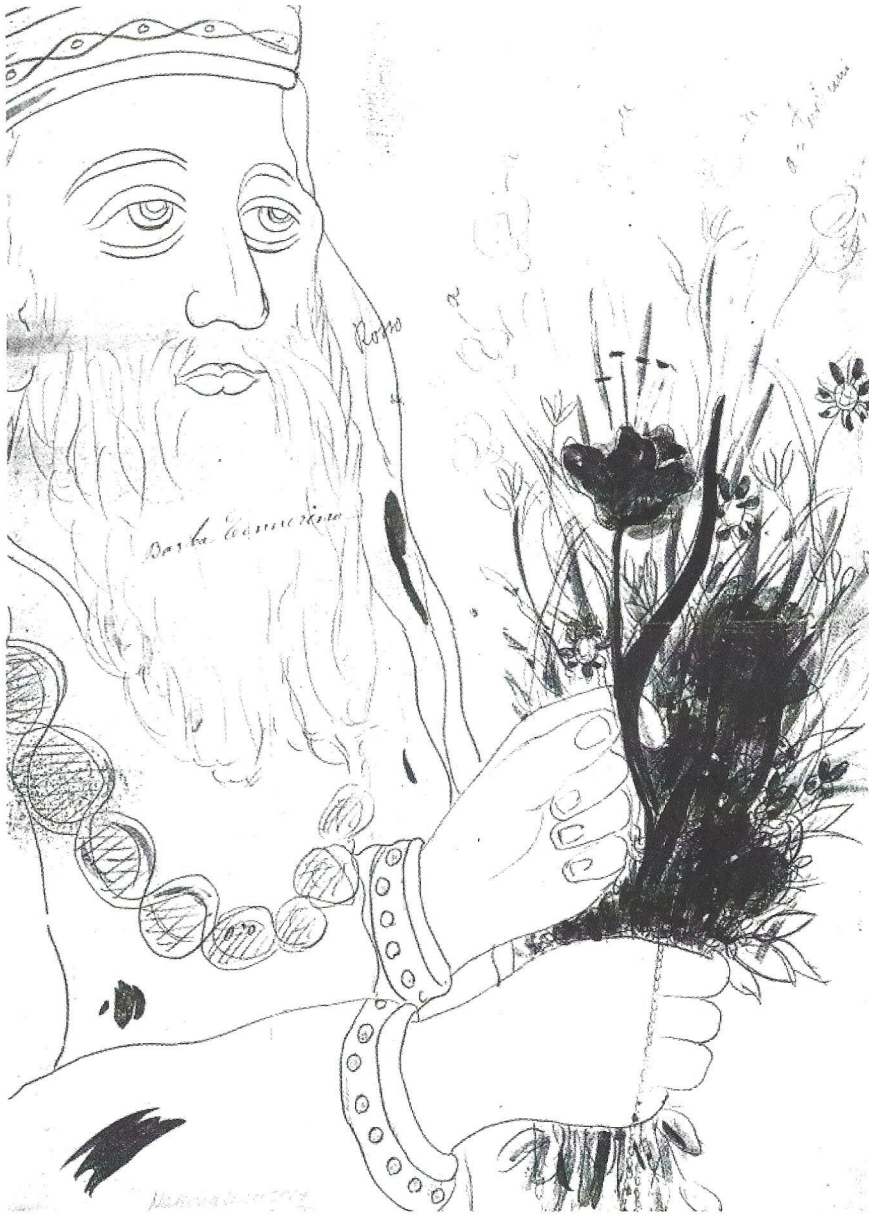
Fig. 4. Tegning af fresken, udsnit, o. 1900. Nationalmuseet, Antikvarisk-topografisk Arkiv.