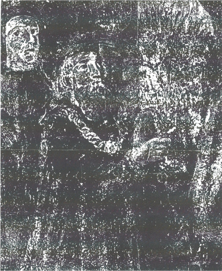
Fig. 2. Udsnit af fresken i Santo Spirito in Sassia, som desværre ikke er tydeligere. Foto o. 1960 i Kunstakademiets Billedkunstneriske Arkiv