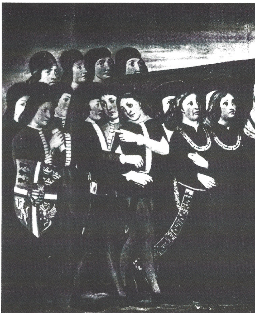
Fig. 3. Vilhelm Rosenstands kopi af freske i Santo Spirito, 1879. Pave Sixtus IV og Christian I.