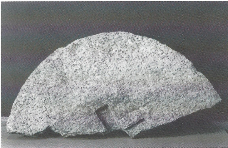
Fig. 3. Møllestensfragment af granat-glimmerskifer