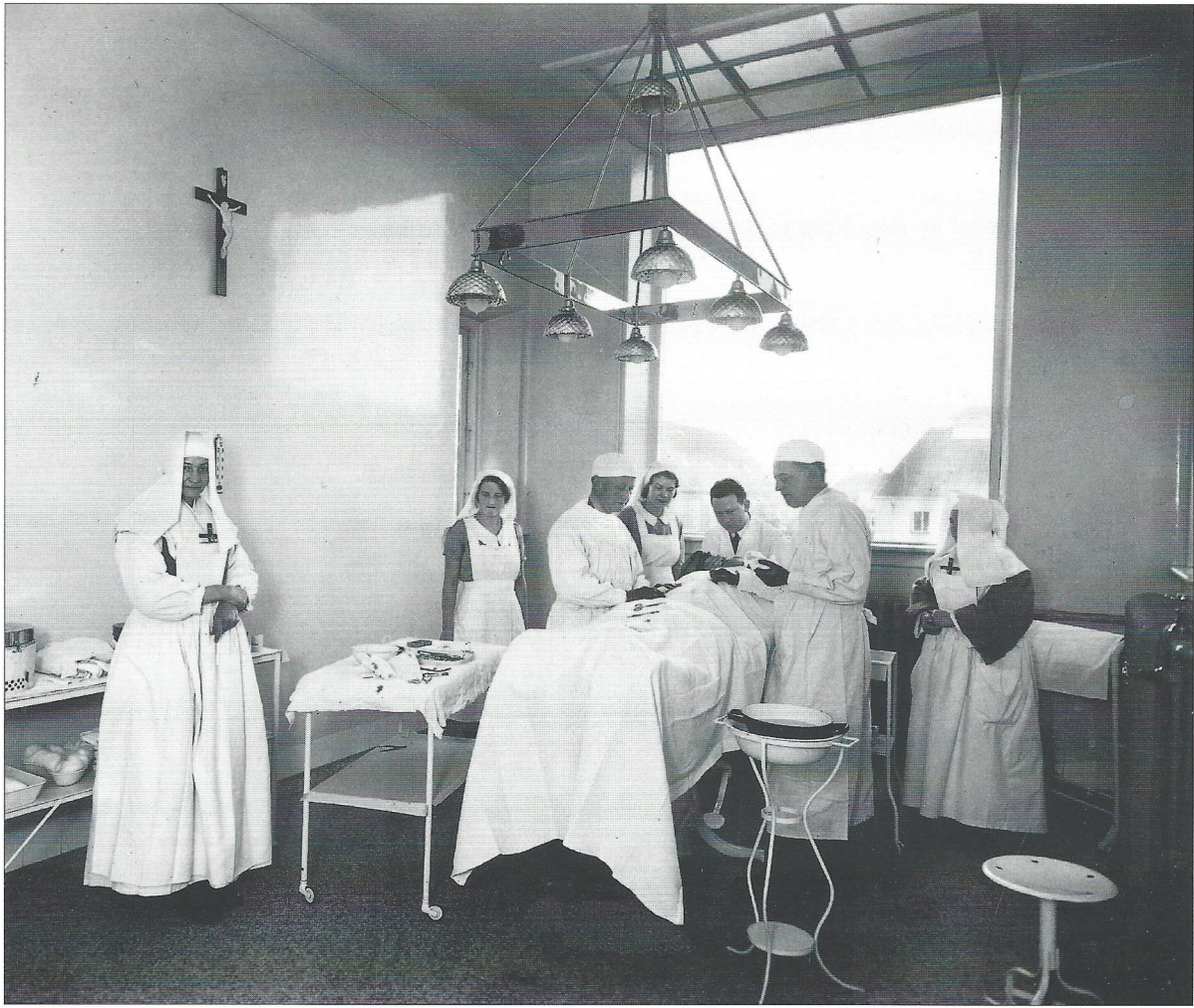
Operationsstuen i Sct. Maria Hospital, som vendte mod nord. Fotografi ikke dateret.