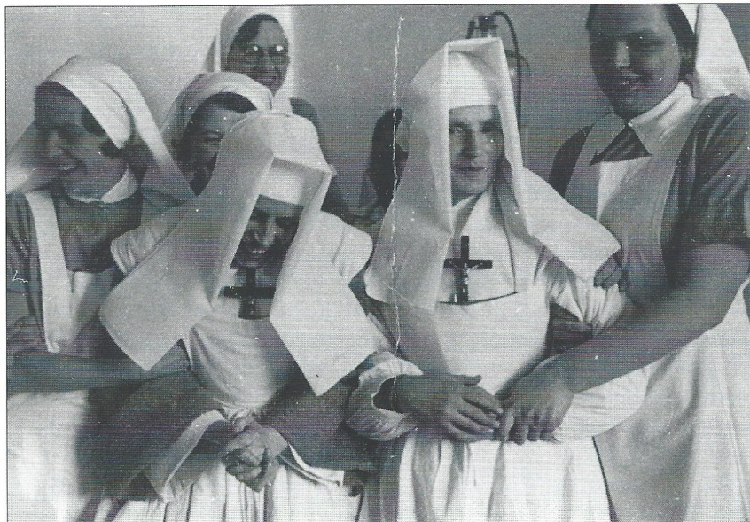
Pjank på operationsstuen på Sct. Maria Hospital. Fotografi ikke dateret.

50-års jubilæet blev fejret med en messe i Sct. Laurentii Kirke søndag den 13. marts 1955, hvor der blev læst messe for alle, der i årenes løb havde været beskæftiget ved hospitalet, og som var gået bort. Den egentlige jubilæumsdag var mandag den 14. marts, hvor der om formiddagen var reception, hvorefter en række indbudte fra byen, bl.a. medlemmer af Roskilde Byråd, Det katolske Udvalg og de indlæggende læger var budt til frokost. Om aftenen afholdtes en personalesammenkomst, hvor