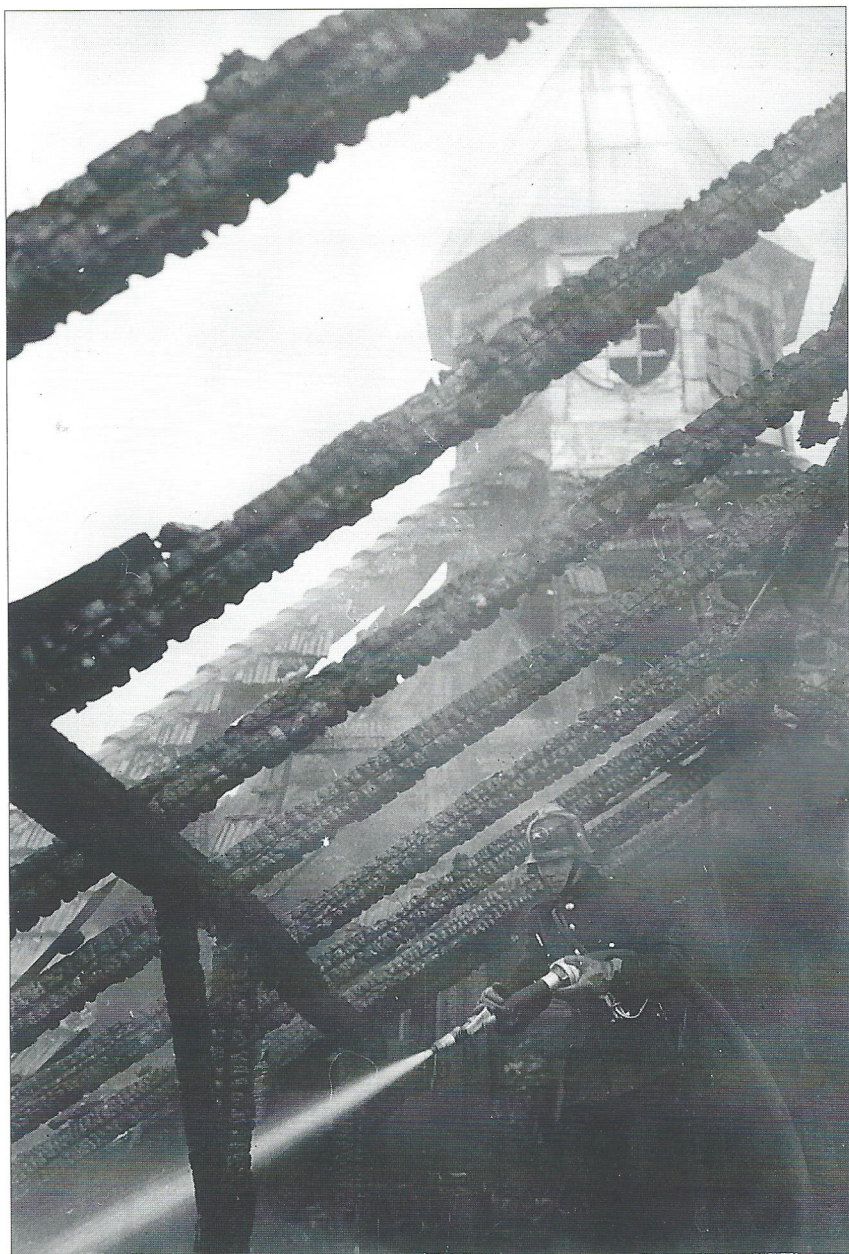
Brandmand bekæmper ilden på tagetagen på Sct. Maria Hospital. Bagved ses tårnet, der ligesom den øverste etage blev ombygget.

talet en periode som studenterkollegium. Da holdtes der bl.a. møder og fester i det gamle kapel.