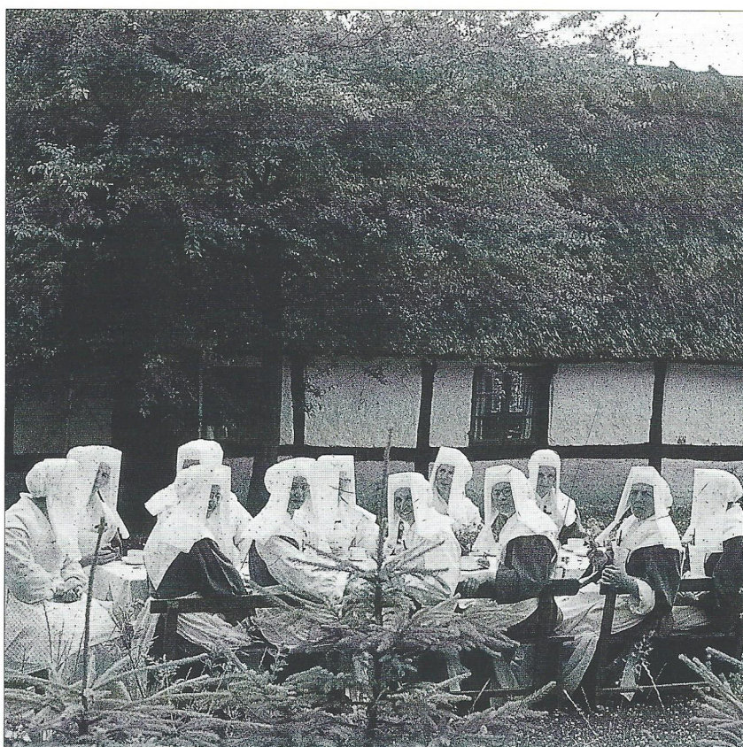
Søstre på "Kisserupgård" i Ledreborg skovene. Fotografi ikke dateret. Privat eje.