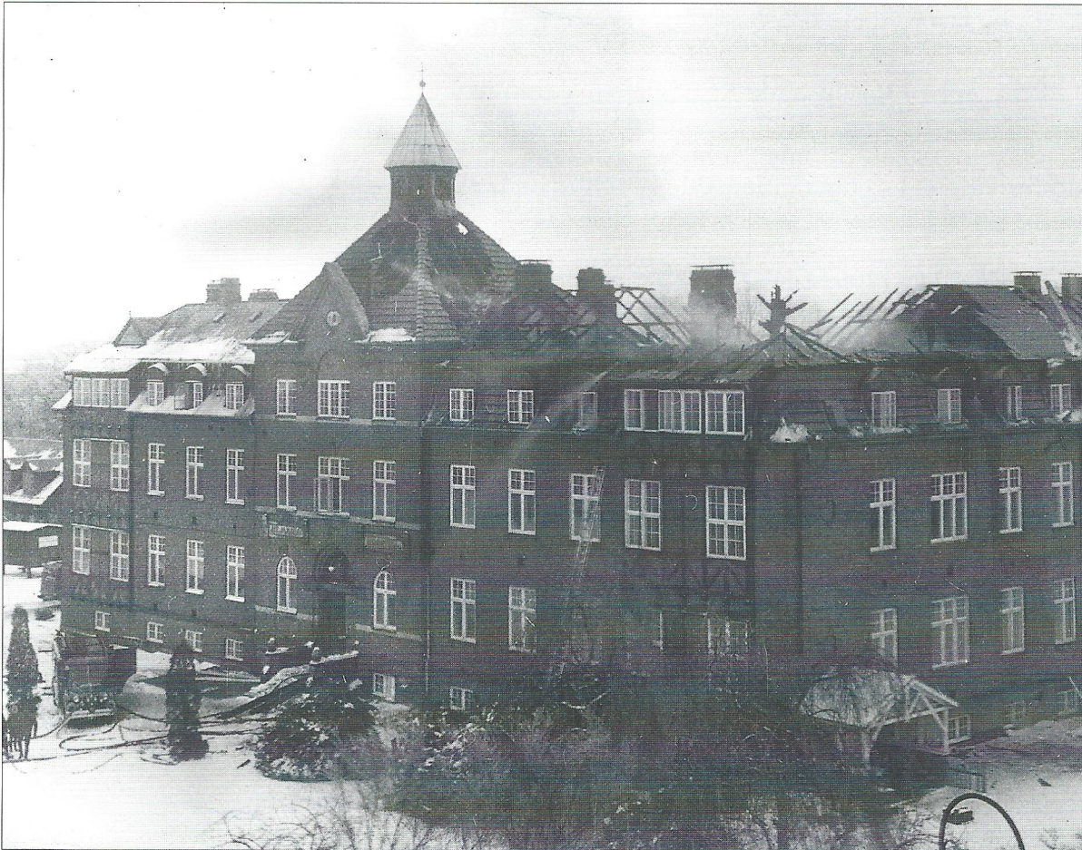
Sct. Maria Hospital brænder 19. februar 1966. Fotografi i privat eje.

truffet adskillige dispositioner, der pegede i den retning. Det store kapel var blevet nedlagt og et mindre nyindrettet i det tidligere kapels kor / apsis. Bænkene var blevet givet til Skt. Maria Kirke i Kalundborg. Det var derfor noget af et chok for søstrene, da de i slutningen af 1980'erne erfarede, at deres plejehjem ikke figurerede i Roskilde Kommunes fremtidsplaner for ældreforsorgen. I 1990 meddelte kommunen, at den ville opsige kontrakten med dem vedrørende plejehjemmet. De foresatte i Holland erkendte, at løbet var kørt. Der var kun fem ældre søstre tilbage, og man havde ingen fremtidig kontrakt med kommunen. Sagen var klar: Ejendommen skulle så hurtigt som muligt sælges til højeste bud, så flest mulige penge kunne frigøres til Visdomsdøtrenes arbejde i den tredje verden.