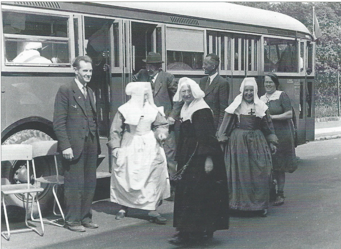
Søstre fra Sct. Maria Hospital er rejseklar. Foto ikke dateret.