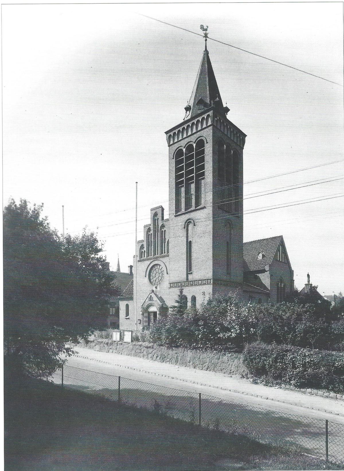
Sct. Laurentii Kirke og frugthaven nord for kirken. Fotografi ikke dateret.