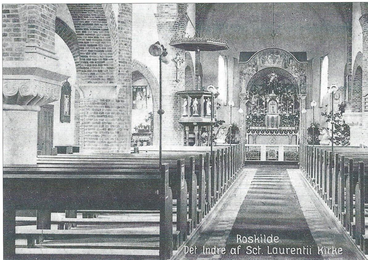
Roskilde. Det Indre af Sct. Laurentii Kirke

Interiør fra Sct. Laurentii Kirke. Postkort. Stenders Forlag. Ikke dateret, men poststemplet 1925.