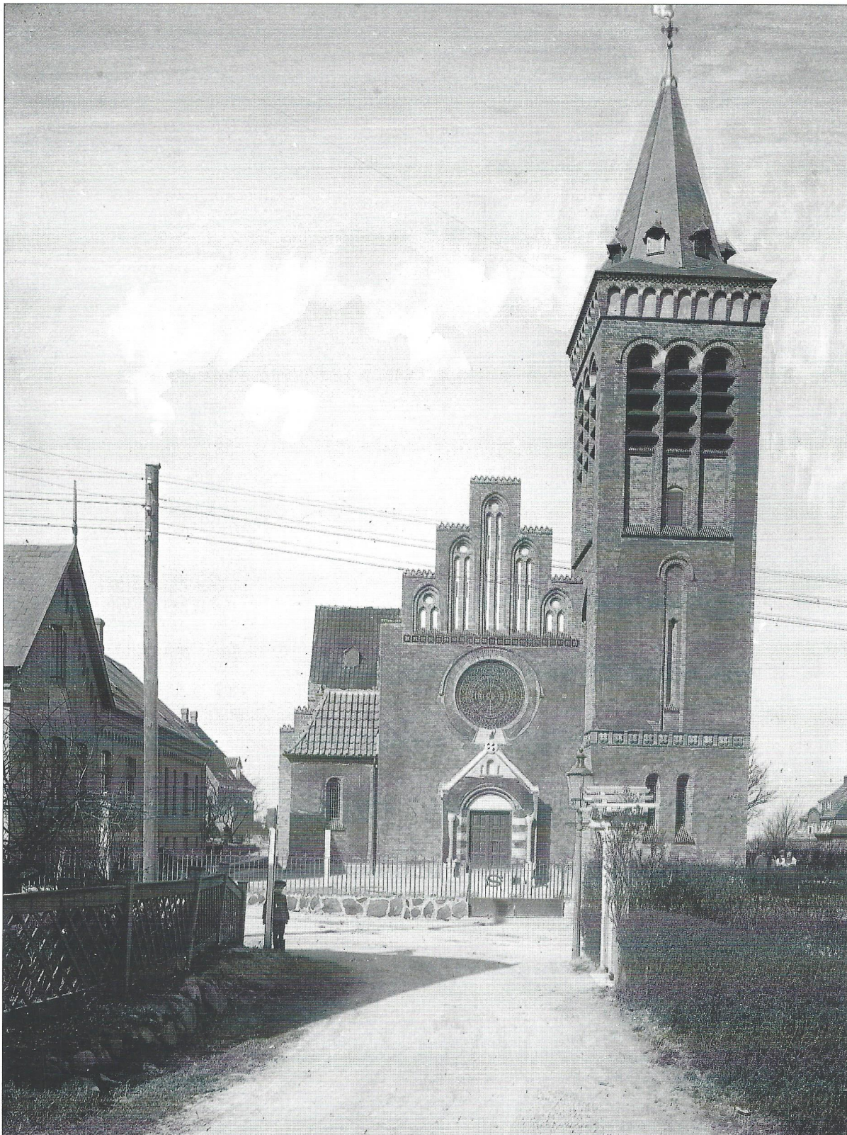
Sct. Laurentii Kirke havde i de første år smedejernshegn og låger med bogstaverne S og L ud mod Frederiksborgvej. Ikke dateret.