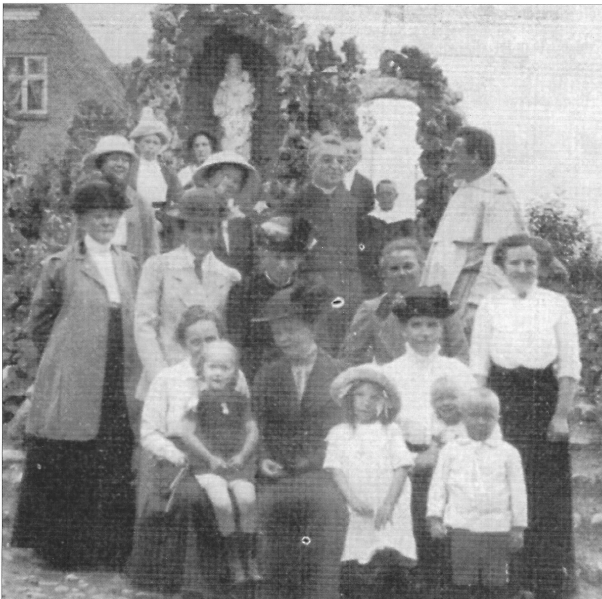
I præstegårdens have omkring 1916.