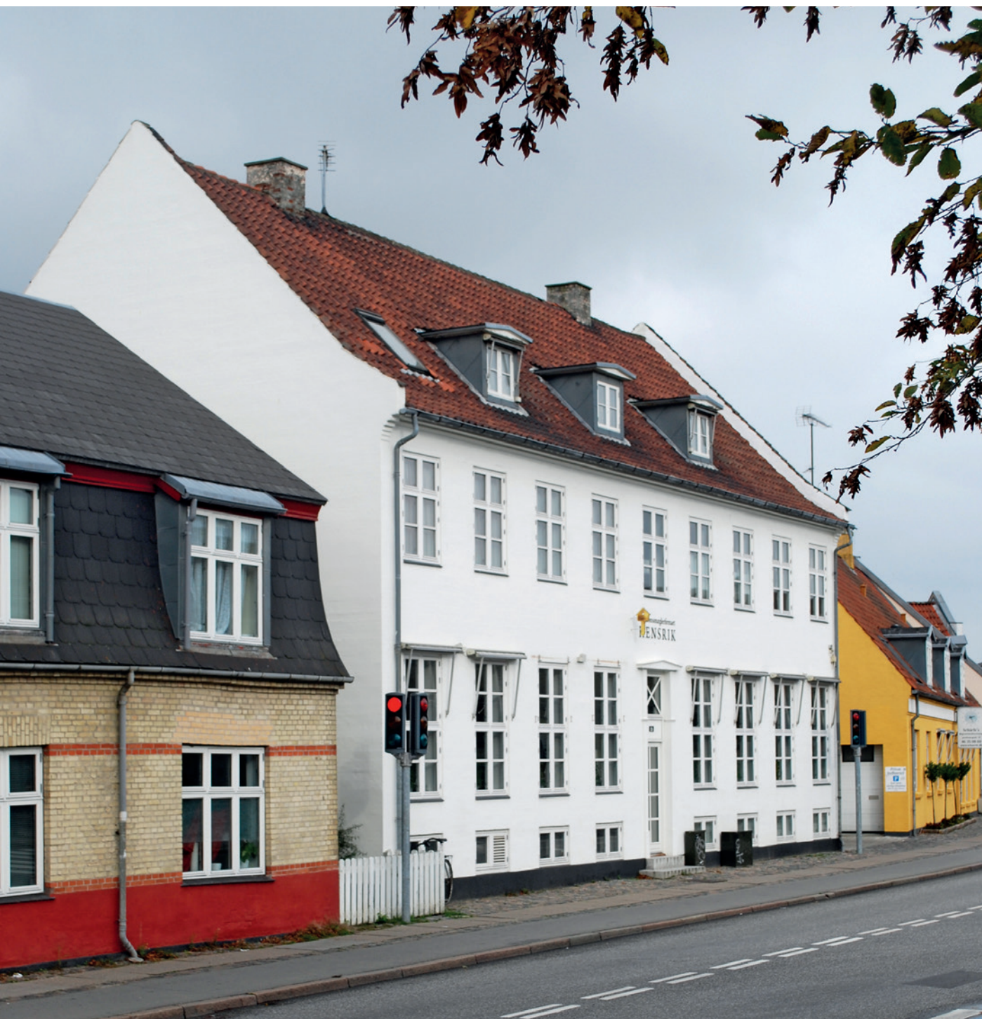
Jernbanegade 12 stod oprindeligt i noble røde mursten, men da huset i 1970'erne blev taget i brug til andre formål, blev det pudset op. Det har haft flere farver. I dag er det hvidt og huser en ejendomsmægler.