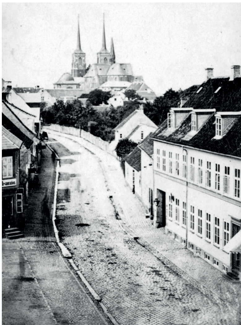
Algade, hvor von Hol- tens hestevogne svinge- de ud fra Hestetorøet, når gæsterne var blevet hentet ved stationen og anbragt i den komforta- ble rejsevogn. Foto: A. W. Rørbye omkring 1860. Roskilde lokalhi- storiske Arkiv.