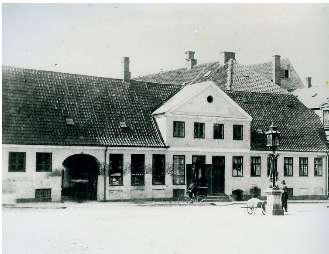
Foto af Borchs købmandsgård på Raadhustorvet 2 før ombygningen 1891, der føjede en ekstra etage til. Ca. 1880.

brug af reklamer. Derfor opnåede han den fine titel som kongelig agent, en ærestitel, der var forbeholdt købmænd og fabrikanter.