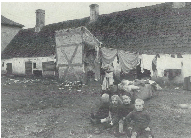
De Borch'ske Huse, Bredgade 4. Købmandsgården strakte sig helt fra torvet til Bredgade, hvor disse fattigrønner lå i passende afstand fra købmandsfamiliens bolig. Det var på ingen måde noget kønt syn, de her ved blev forskånet for. Nedrevet 1907. Omkring 1900.

Lejlighederne bestod af et vindfang med åben skorsten delt med nablejligheden, hvor husmødrene kunne lave mad over åben ild på en såkaldt ildbænk. Herfra førte to døre ind til to stuer – hver beboet af en af de to familier, der delte køkken. Eventuelt kunne større børn sove oppe på loftet lige under taget i kulde om vinteren og varme om sommeren, indtil de var store nok til at sende ud at tjene. Bag husene var der et fælles das. Trods lave huslejer har de sammenlagt bidraget til, at købmanden og hans familie kunne leve et liv i luksus – på bekostning af andres fattigdom.