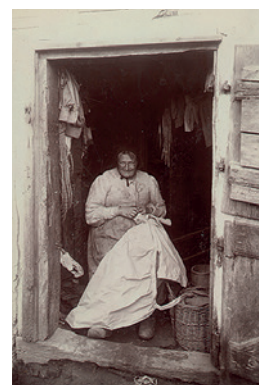
Fattig kone i De Borch'ske Huse i gang med sytøjet. Hun er rykket frem til døren for at få bedre lys til sit arbejde. Omkring 1900.

Kl. 11 var der en solid frokost med våde varer på "Børsen". Det satte stemningen i vejret, men gavnede næppe træfsikkerheden. Om eftermiddagen var der musik i Børsens have, og nu spadserede byens unge piger og fruer ned til havnen for at se på løjerne og beundre sølvgevinsterne. Når brystpladen endelig var skudt ned, lød der 9 kanonskud. Så vidste alle, at byen havde fået en ny fuglekonge. Siden spad-