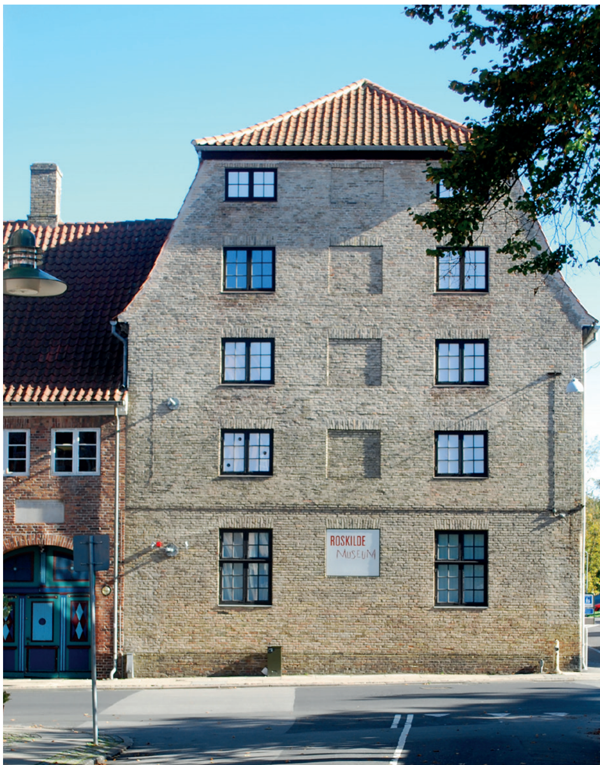
Sukkerhuset og Liebes Gård (med porten) har haft forskellige funktioner gennem årene, men danner i dag en værdig ramme om Roskilde Museum. Foto: Jeppe Tønsberg 2018.