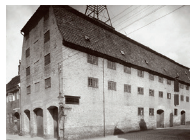
Sukkerhuset omkring forrige århundredskifte med telefonantenne på taget. Der var tale om solidt byggeri, der kunne overleve senere tiders ombygning til andet brug, endog brandstation i begyndelsen af 1900-tallet. Ca. 1900.