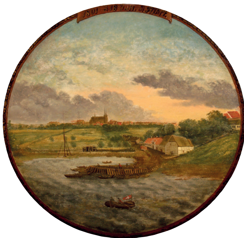
Fugleskydningen i Roskilde foregik ved havnen i slutningen af 1700-tallet. Her ses Halkjærs skibsbro i forgrunden på Peder Fischers skydeskive fra 1801. Foto: Bennie Hansen for Fugleskydningsselskabet for Roskilde og Omegn. Roskilde Museum.