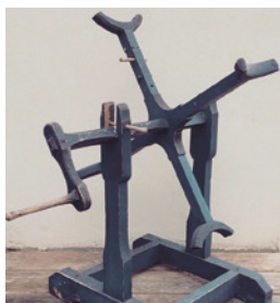
Primitiv garnvinde af en type, som var meget udbredt tilbage i tiden, således også i 1600-tallet. Hvis man ikke var så heldig at redde sig lidt brugt tøj kasseret af bedre bemidlede folk, måtte man selv fremstille det fra grunden af ved at karte, spinde, væve eller strikke. Ukendt proveniens.

gade. De små lejligheder i disse lave længer bestod typisk af et enkelt værelse med adgang til et vindfang, hvor man kunne lave mad.