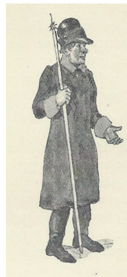
Vægter i tidens uniform, som også Mons Vægter bar, når han var på vagt i det gamle kirketårn. Tegning: Jacob Kornerup. Gengivet efter Kornerup, Jacob: Fra det gamle Roskilde . Roskilde 1925, s. 31.

Mons og konens indbo var heller ikke prangende, som det er beskrevet i taksationen af de fattiges indbo. Hans ejendele bestod af "... et gammelt Sengested med 3 gamle Dyner, 2 Hoved-