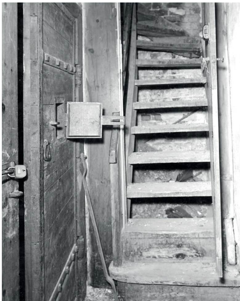
Trappen op til tårnvægterens rum i Sct. Laurentii rådhusårn. Den kunne være en uoverstigelig hindring for en vægter at forcere i en brandert. Ca. 1900.