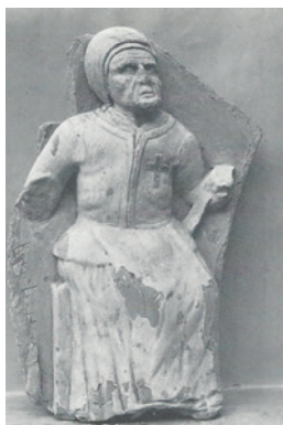
Relief med fattig kone iført den traditionelle klædedragt for kvindfolk, der ikke havde råd til at følge de skiftende moder. Gengivet efter Christmas Møller, Ingeborg: På fattighuset: Greve Hospital og andre fattighuse på landet i 1700- og 1800-tallet. 1978.