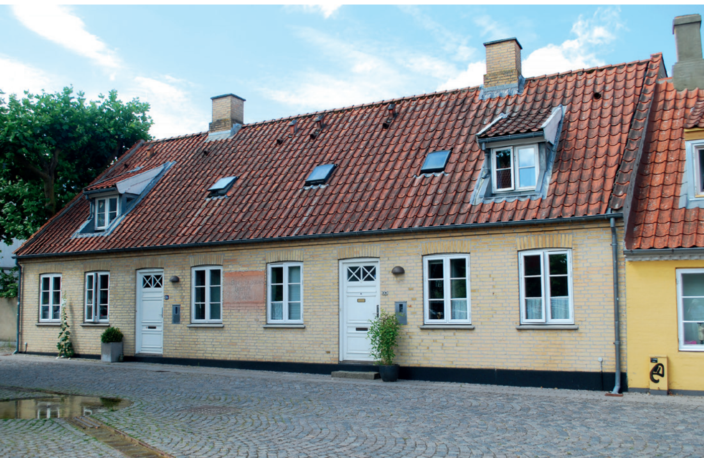
Huset Rosenhavestræde 3 er opført som en tro kopi af det gamle hospital, men kun i det ydre. I det indre lever huset op til den bygningsmæssige standard, som man brugte i 1987.