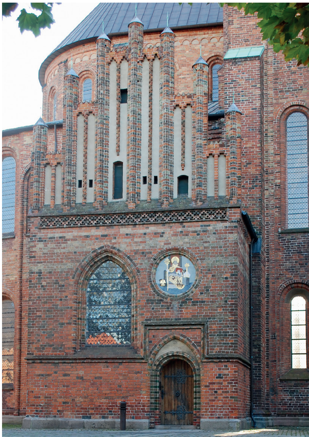
Oluf Mortensens våbenhus, ligeledes opført i Bo Madsens embedsperiode. Et lille arkitektonisk mesterværk, som vi stadig kan glæde os over. Foto: Jeppe Tønsberg 2018.