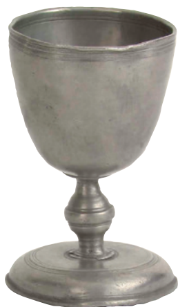
Alterkalk af samme ydmyge type som den hr. Bo fik med sig i graven. Museumsgenstand i Norsk Folkemuseum i Oslo.