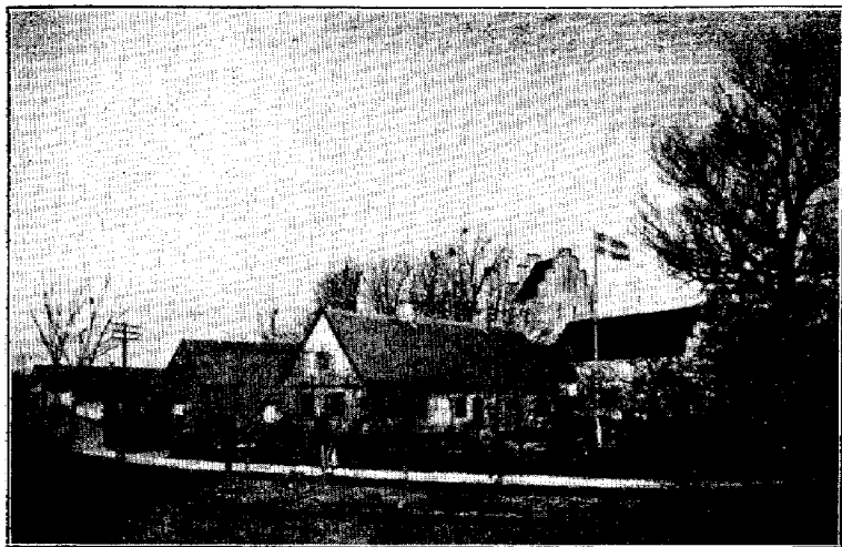
Karlslunde gamle Skole 1908.