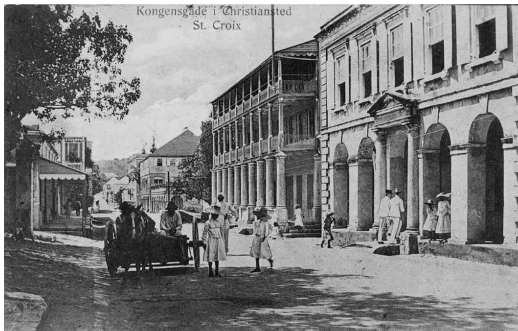
Et billede fra Kongensgade, Christiansted, St. Croix.