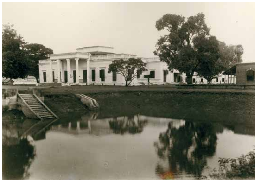
Guvernørboligen i Frederiksnagore. Opført 1771 og regnedes for at være en af byens smukkeste Bygninger (Museet for Søfart, Helsingør).