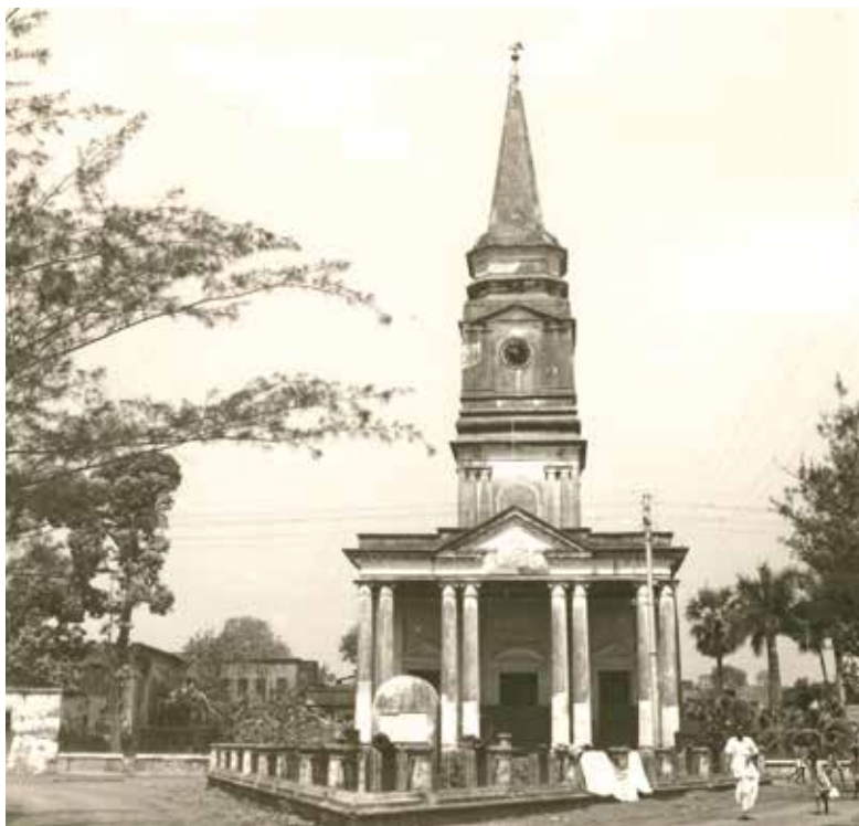
St. Olavskirken i Serampore.