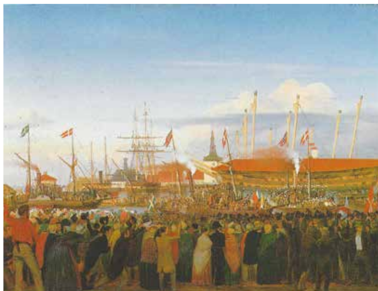
De svenske og norske studenter ankomst til studenter mødet i København 1845. Jørgen Sonne 1847.

I alt deltog 468 i naturforsker mødet, 275 danskere, 91 svenskere, 34 nordmænd, 68 fra Slesvig-Holsten samt 8 fra andre