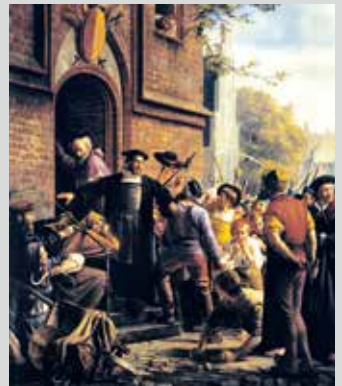
De syv vægmalerier i festsalen.