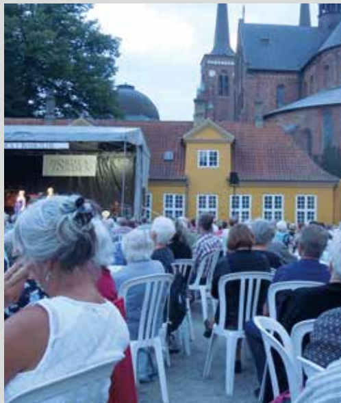
Festklædt publikum i Palægården til Operakonzert med spising.