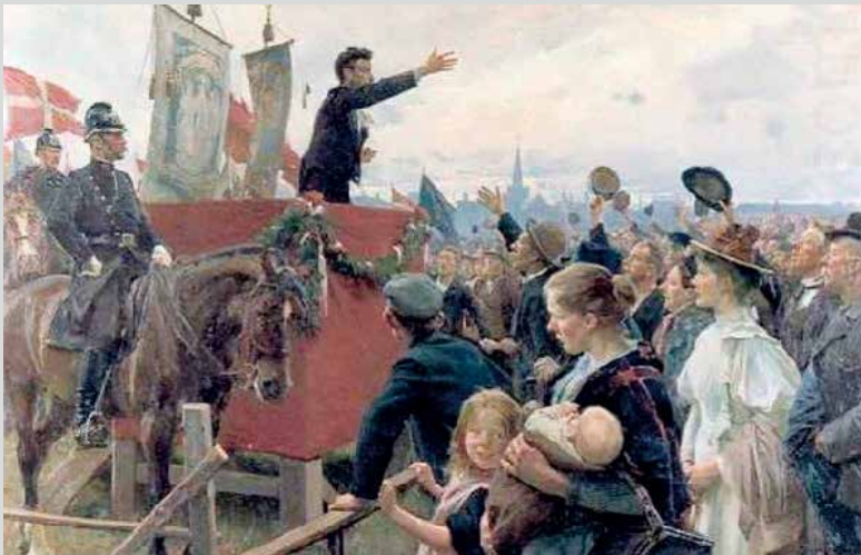
Fire af Erik Henningsens kendte malerier.