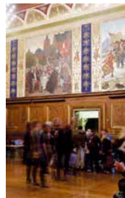
Universitetets festsal i dag.

Det gav nu ikke længere nogen mening at udskrive en åben konkurrence om det sidste motiv med naturforskerskermødet. I 1893 fik rektor de tre ovennævnte professorer til at redefinere emnet for det tilbageværende maleri til en scene fra naturforskerskermødet 1847 hvor "hele Mængden af Datidens nordiske Berømtheder på Naturvidenskabernes Omraade havde været repræsenteret. " Udvalget skulle også pege på de