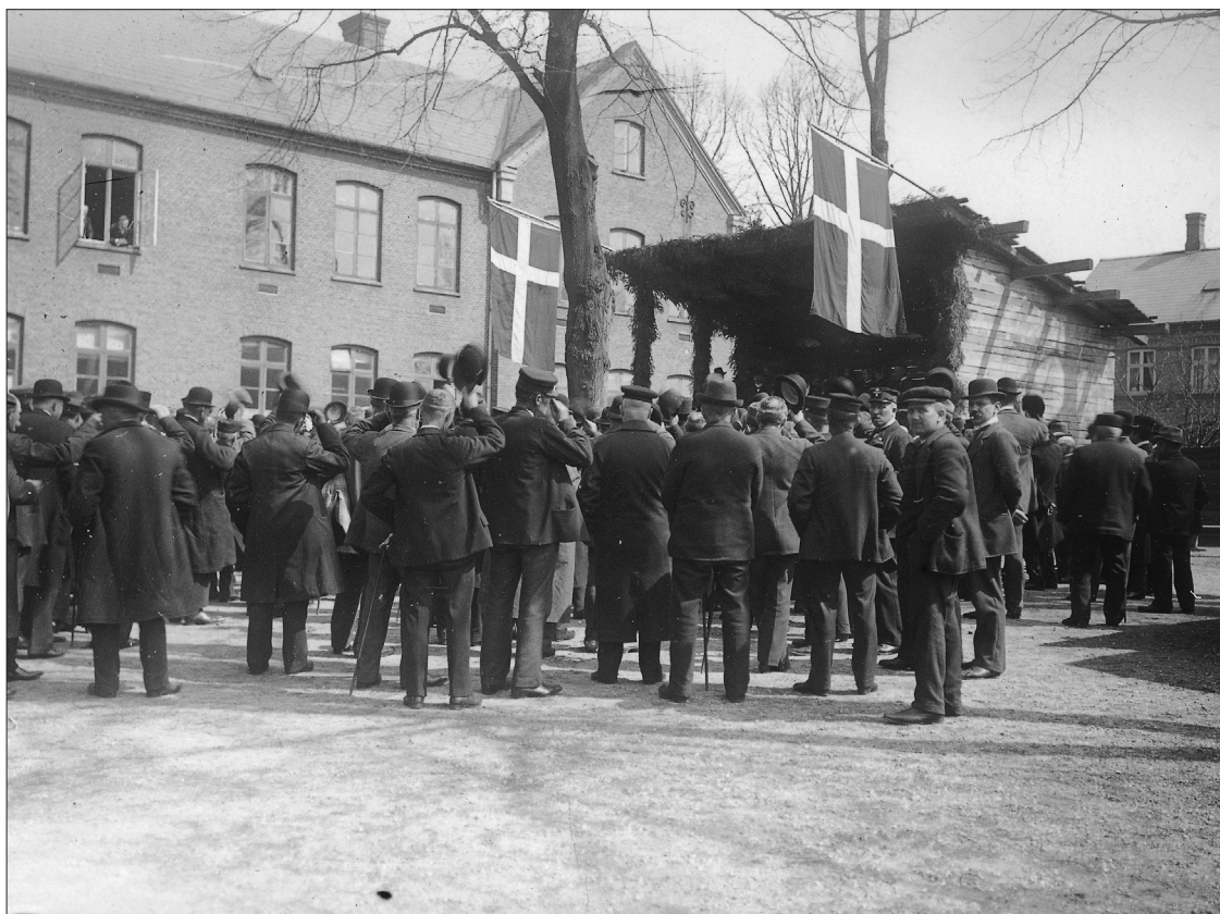
Valghandlingen i Borger- og Realskolens gård i Allehelgensgade. 1890'erne.

man valghandlingen til Borger- og Realskolen i Allehelgensgade, det nuværende VUC.