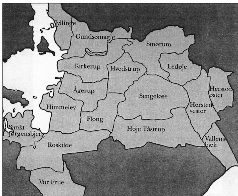
Roskilde kredsen. Københavns Amts 5. valgkreds, 1849-1915. Roskilde bys historie bd. 3, 1998, s. 134.

Roskilde var en mellemstor kreds, Køge lidt mindre, medens Lejre var landets mindste kreds vælgermæssigt. Således havde Roskilde i 1913 4796 vælgere, Køge 3944 og Lejre 2393. Gennemsnittet for Danmark var da 4311, og 13 kredse havde mere end 6000 vælgere. 3