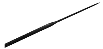
Landeværnsspyd, som blev brugt af danske soldater i 1807. Findes på Roskilde Museum.