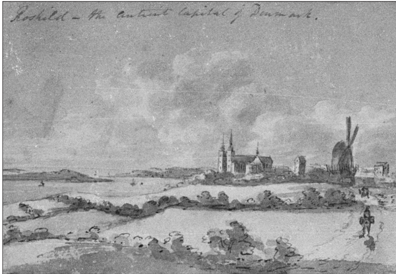
Skilderi af Roskilde by set fra syd, formentlig udført af en englænder i 1807. Tilhører Roskilde Museum.

Trøjer, hvide Benklæder og lave, sorte Chakots. Fulgte af sin Reserve rykkede Kjæden ned mod Byen, idet den saa at sige afsøgte Terrænet Fod for Fod, og den var allerede kommen forbi os, før vi opdagede den egentlige Kolonne, som var meget stærk og sammensat af alle tre Vaabenarter. Snart var den hele Styrke samlet paa Markerne uden for Gaarden, og Resten af Aftenen var der et stærkt Røre imellem de fjendtlige Tropper...[...] Paa Marken bag Gaarden og mod Brønshøj vare de Menige travlt beskæftigede med at indrette en Bivuaak af Straahytter, og overalt saa man engelske eller hannoveranske Soldater, der, som oftest kun iførte Skjorte og Benklæder og med Ærmerne opsmøgede til Albuen, enten kogte Mad i Feltkjedlerne eller slæbte Halm, Buskværk og Stænger sammen til Lejrens Bygning. 25