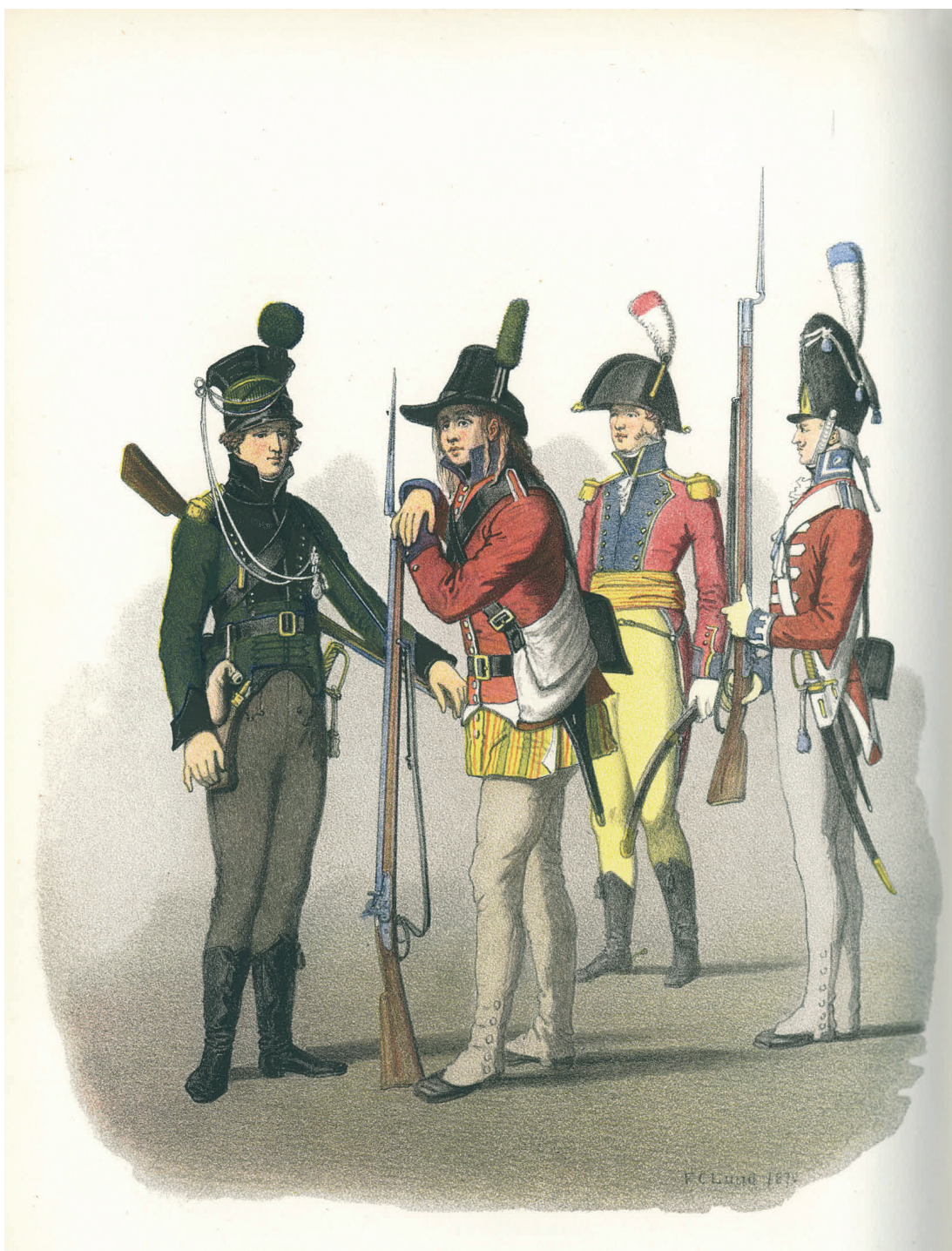
Soldater fra den danske hær 1807: livjæger, landeværn, borgerofficer og garde. Tegning fra Otto Vaupell: Den danske Hærs Historie, bd. 2.