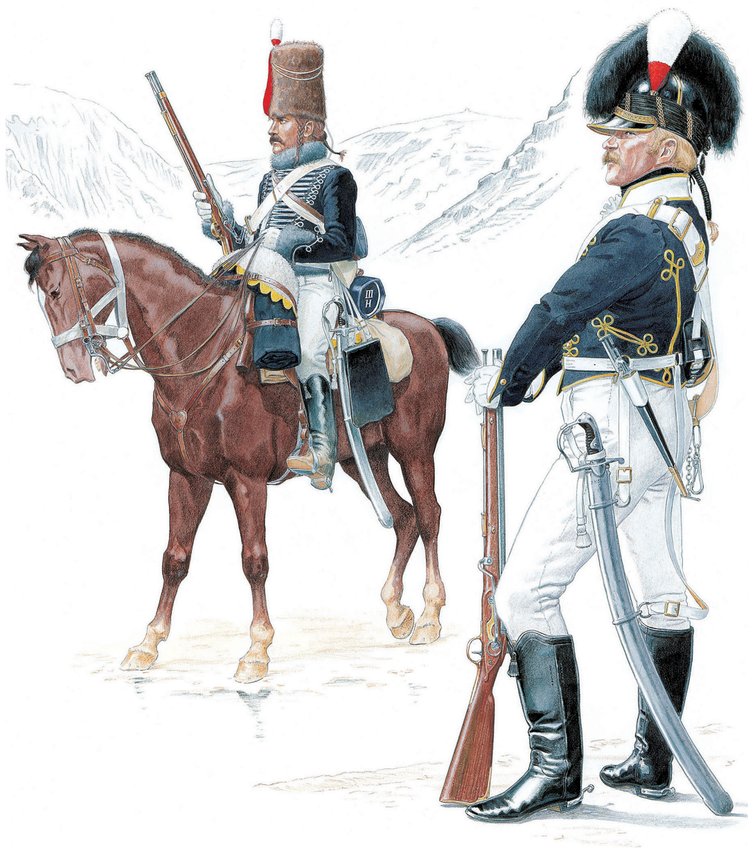
Soldater fra den engelske hær, der som professionelle soldater var veltrænede og skrappe, men også dygtige. Tegning af Mike Chappell af MAA 388 King's German Legion (1).