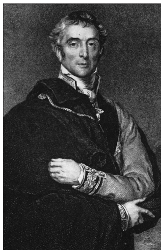
General Arthur Wellesley, den senere Hertugen af Wellington.