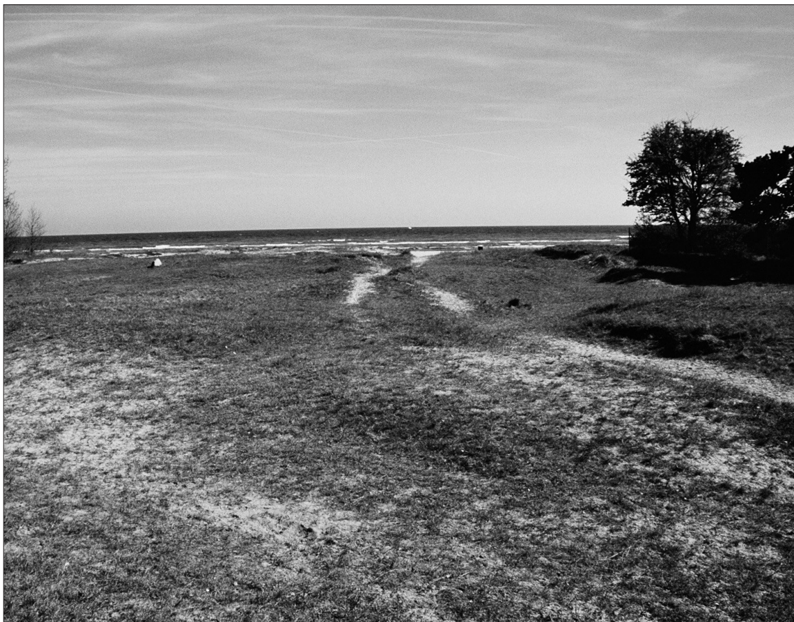
Aktiestykket ved Karlslunde Strand, hvor der er påvist en middelalderlig anløbsplads.

træer ind mod land. Aktiestykket kan muligvis være stedet for Gunnerøgle, som omtales nedenfor.