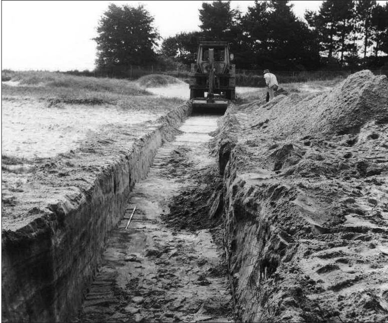
På anløbspladsen ved Aktiestykket var der spor af mørkere, sandede kulturlag med trækul samt lerforede gruber.

fundtes en større grube, ca. 2m bred og 0,5m dyb, hvor der i bunden var et rundovalt, skålformet og lerforet ildsted omgivet af en del trækul. I bunden af gruben fandtes ikke spor af stolpehuller, pæle eller sten, som kan have støttet et overdækkende telt. Mod vest blev der fundet et forsænket ildsted nær en større grube, der indeholdt trækulsholdigt fyld og et middelalderrandskår. Udgravningsområdet blev gennemgået med detektor, men der fremkom ikke flere mønter.