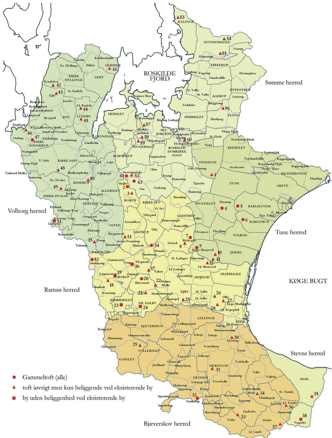
Fig. 5 Navne der indeholder ordet toft vil ofte give fingerpeg om ændrede bebyggelsesforhold, når navnene ikke (længere) ligger ved eksisterende landsbyer. Det gælder dog ikke Gammeltoft-navnene, for også tæt ved nuværende by vil de typisk bære vidne om, hvor denne tidligere har ligget.