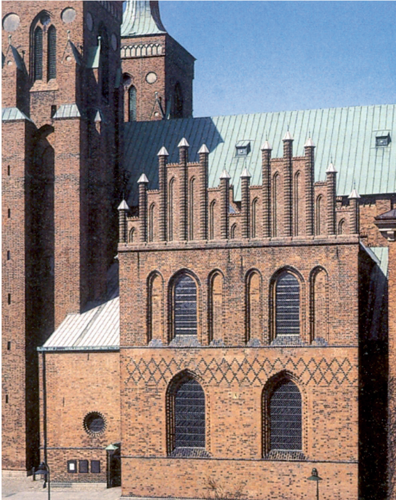
Helligtrekongers Kapel. Den gotiske facade er undergået flere ændringer i tidens løb.

Fyr, som han misligholdt til skade for søtrafikken.