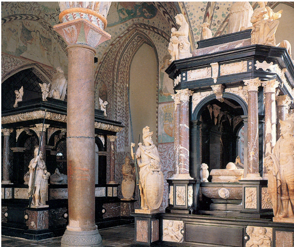
Helligtrekongers Kapel. Christian d. 3.'s og Frederik d. 2.'s renæssancegravmæler.

af indskuddet, han blev lagt i lænker på Hven uden dom, og hans regnskaber og papirer beslaglagt. Desuden blev han også imod fæstebrevet pålagt hårdt hoveriarbejde, så to af hans heste døde, og arbejde og fortjenesten på gårdens jord overladt til andre. Uden held forsøgte Roskildes borgmester at forlige parterne.