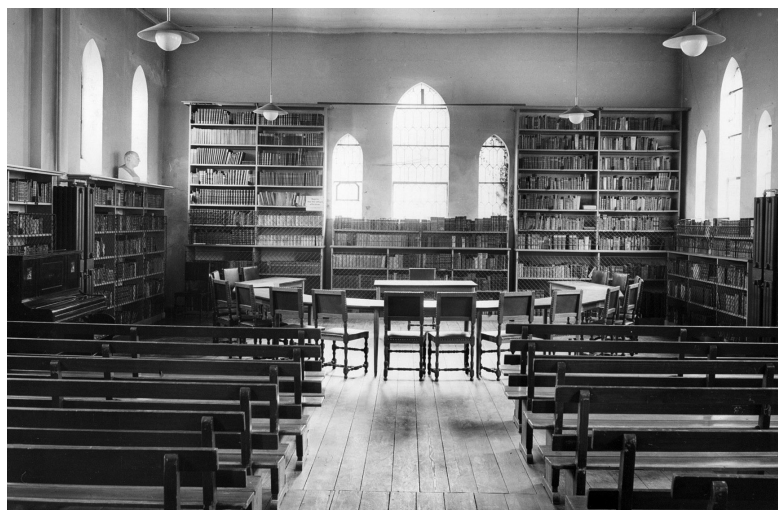
Reolopstilling efter 1906.

I kirkelige kredse havde man længe savnet et egnet lokale til afholdelse af møder for hele menigheden, og ved domprovst Skovgaard-Petersens mellemkomst blev det ordnet således, at Stifts-