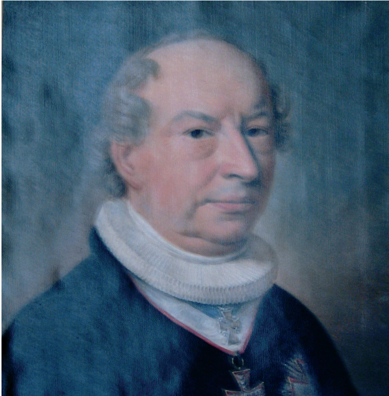
Biskop Frederik Münter.

manglede og, hvad der var, var mindre propert.”