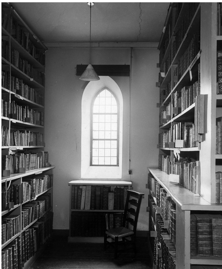
Stiftsbiblioteket, nuværende konventhus set fra vest.

se i Roskilde Domkirke), men som et rekonstrueret nyttebibliotek. Til dette bibliotek burde man da overdrage den teologiske litteratur fra Stiftsbiblioteket og lade den danne grundlag for et "Kirke – eller Menighedsbibliotek", ikke af almindelig videnskabelig-teologisk tilsnit, hvor Statsbiblioteket gør tilstrækkelig fyldest, men med "det praktiske Kirkelivs mangeartede Livsytringer hjemme og ude som sin Hovedopgave".