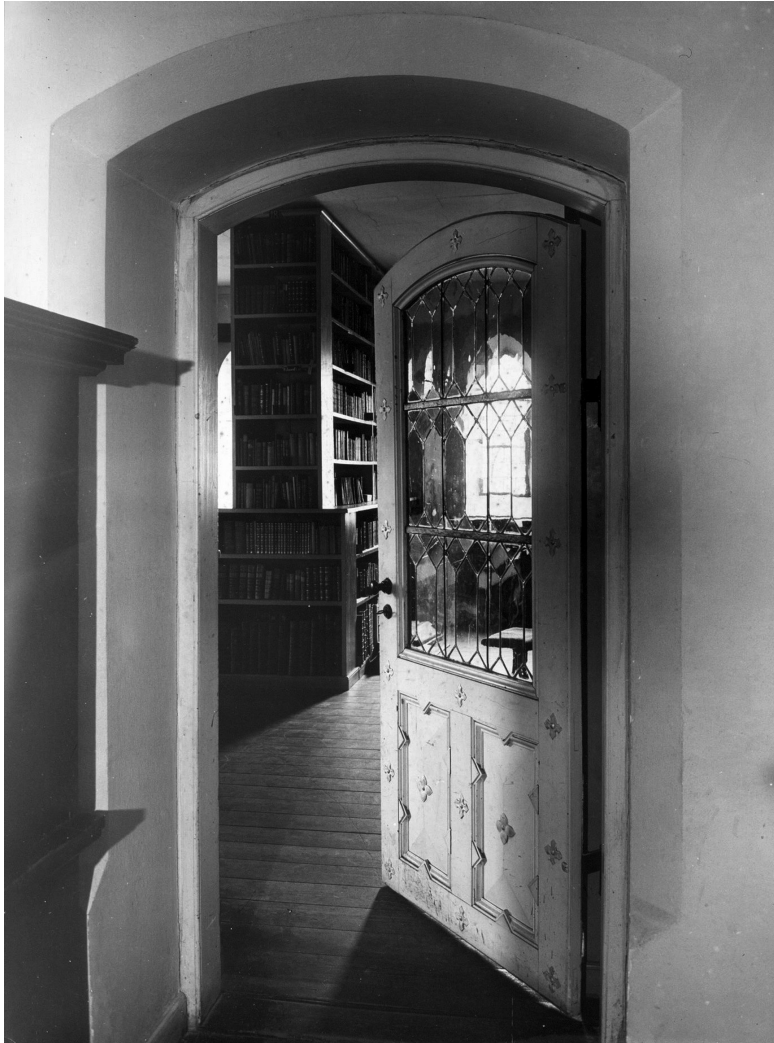
Interiør fra Stiftsbiblioteket før 1961.

biblioteket blev opstillet på en ny måde, og salen kunne tages i brug som menighedssal. Den 10. november 1931 blev den nye sal i Roskilde taget i brug ved Roskilde Konvents møde.