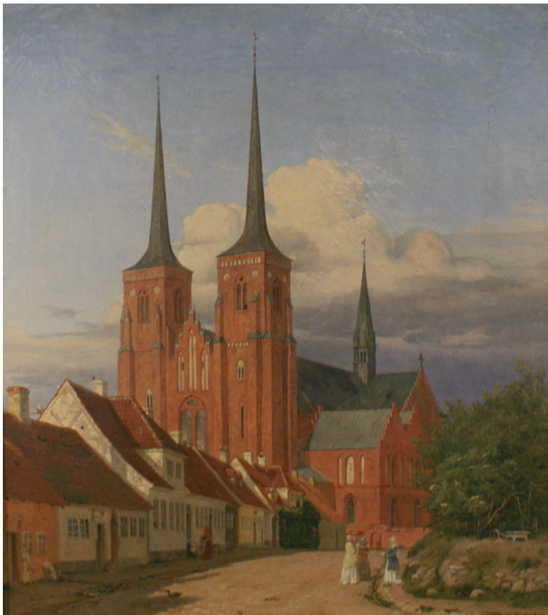
Jørgen Roed malede dette motiv af Domkirken og Bondetinget flere gange omkring 1835. Roskilde Museum

I det følgende vil jeg prøve at beskrive byen og dens indbyggere ud fra samtidige kort, billeder, beretninger og folketællinger.