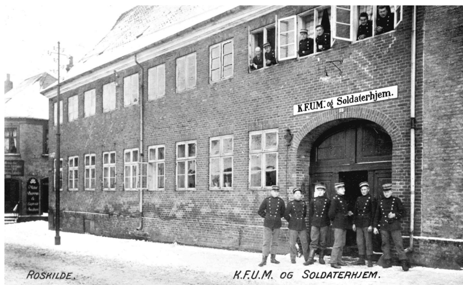
KFUM's Soldaterhjem i Roskilde. Her bor i dag Roskilde Museum.

Tunestillingen: Den skulle "så længe som muligt [...] hindre en syd eller vest fra kommende fjende i at nå det terræn, hvorfra han vil kunne bombardere hovedstaden." Men det virker ikke, som om beslutningstagerne mente det alvorligt. Til sammenligning havde søbefæstningen og landbefæstningen kostet henholdsvis 11 mill. kr. og 21 mill. kr. I 1916 blev Mosede Batteri færdigt, – og det er interessant, at det er næsten 2 år inde i krigen. Byggeriet var ikke blevet gjort hurtigere færdigt og i øvrigt ser det ud som om der ikke var gjort noget fra 1914 til 1916 for at forsvare Danmark mod en landgang i netop det område!