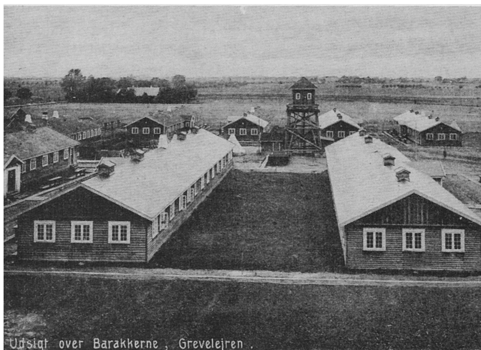
Postkort, der viser soldaterlejren i Greve: Grevelejren.