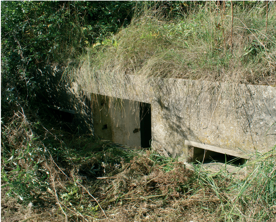
Tokhøjhulen som den ser ud i dag, hvor den er godt kamoufleret. Hulen ligger på Tokhøjvej, sidevej til Tunevej.

der havde håndgranater. Militæret var derfor nødt til at tredoble antallet til 100 000 håndgranater, og dem prøvede man at købe i Storbritannien. Men det var alt for lidt, for selv med det antal ville der kun være 3 granater til hver soldat, og det kom man ikke langt, med hvis fjenden angreb stillingen.