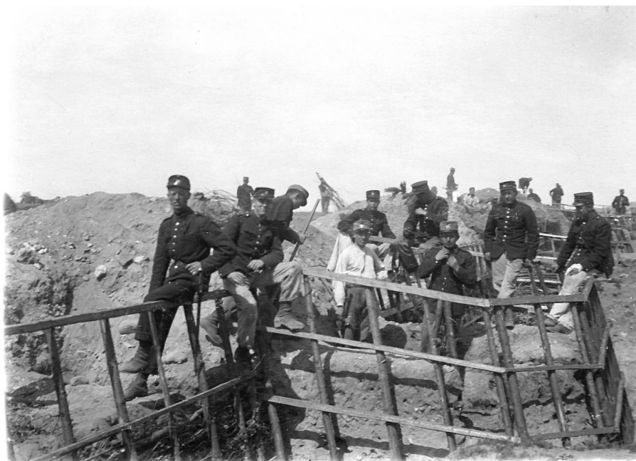
Bygning af afsnittet på Veddelevhalvøen - sikkert i slutningen af 1915, fordi soldaterne får grå uniformer i 1916.

Det interessante er, at alle historikere kun har fokuseret på den tyske interesse i at holde den britiske flåde ude af Østersøen. Der er ingen, der har vendt problemstillingen på hovedet, for så ville man indse, at Storbritannien også havde en stor interesse i en minelægning. Den "omringning" af Tyskland, som den britiske flåde skulle foretage blev med et slag reduceret til at dække det sydøstligste område af Nordsøen, og det var en betydelig gevinst for Storbritannien!