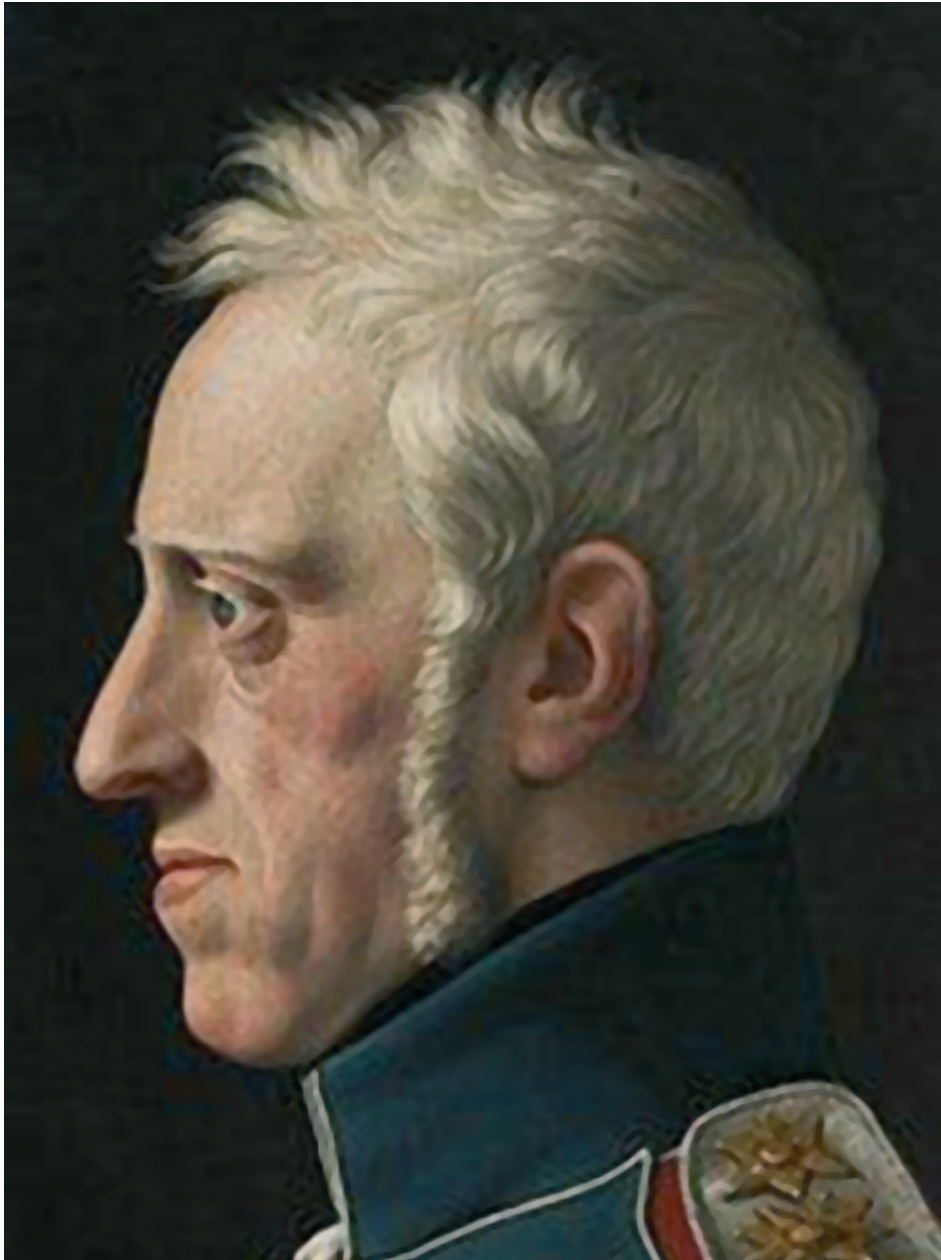
Frederik 6. var interesseret i skolevæsen - også for menigmand. Derfor fik Danmark en folkeskolelovgivning i 1814. Malet af C.W. Eckersberg 1820.

tidspunkt er uden tvivl oprettelsen af Stænderforsamlingerne. Disse forsamlinger - en for hver landsdel - kan betragtes som forløbere for Rigsdagen (Folketing og Landsting). De havde ikke lovgivende magt, men kunne alene give den enevældige rege-