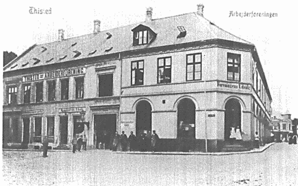
Thisted Arbejderforenings bygning, hvor der fra 1876 blev solgt øl og brændevin. Til venstre ses læsestuen, der var betydeligt større end Afholdsforeningens. Arbejderforeningen påtænkte at bygge en forsamlingsbygning i 1884, men opgav formentlig på grund af, at afholdshjemmet blev bygget samme år. Udateret postkort på Det kongelige Bibliotek.