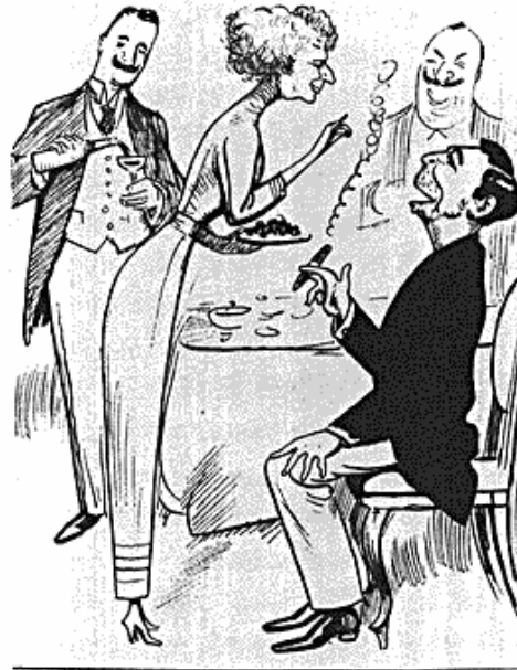
Under selskabelige Former

Jeg var med som Gæst og fælle mig som sådan sikret mod Offentlighedens Indblanding i vor rent fortrolige Samtale.