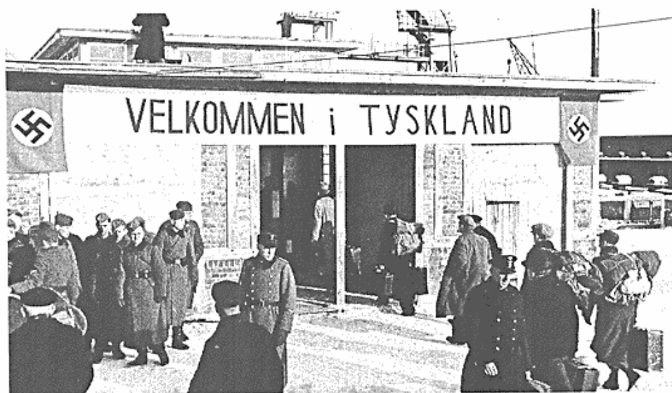
Danske tysklandsarbejdere bydes velkommen ved den dansk-tyske grænse.

fra det samlede antal, men det kan muligvis hænge sammen med aldersfordelingen. Medens der var ca. lige mange DNSAP-medlemmer under som over 30 år, var der i det samlede tal overvægt af personer under 30 år.