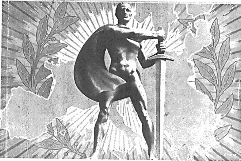
Forsiden fra et tysk propagandaskrift. Begrundelsen for at f.eks. danskere skulle tage arbejde i Tyskland var bl.a.: »Vi maa undgaa det asiatiske Slaveri saavel som den amerikanske Trældom«.

administreret af kontoret, der også sørgede for andre økonomiske transaktioner, såsom udbetaling af bonus, forskud, erstatninger, udpantninger o.l.