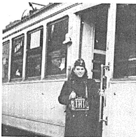
Dansk sporvognskonduktør i Langenberg ved Wuppertal.

hed det sig, at de krigsvigtige virksomheders behov gik forud for alt andet, og de ideologiske principer måtte skubbes i baggrunden.