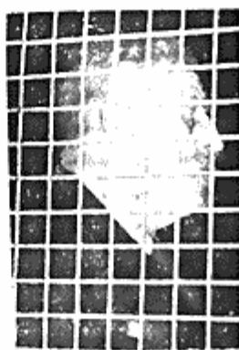
Frits Clausen Fotografert under Interrogatorien.

O MSIDER -- næsten to Aar efter Befrielsen -- foreligger Udkastet til Anklageskrift i Sagen mod den Mand, der mere end nogen anden er kommet til at staa som Danmarks Quisling, Frits Clausen, Sagens Akter er et bindstærkt Værk, og der er ikke mindre end 2000 Bilag. Det er dog ikke alene Arbejdets Omfang, der er Aarsag til, at man har maattet vente saa længe paa Opgøret med DNSAP's Leder. Flere af de andre Forræderisager griber saa direkte ind i Frits Clausen-Sagen, at Nødvendigheden af at vente til sidst med denne Sag er synlig for enhver.