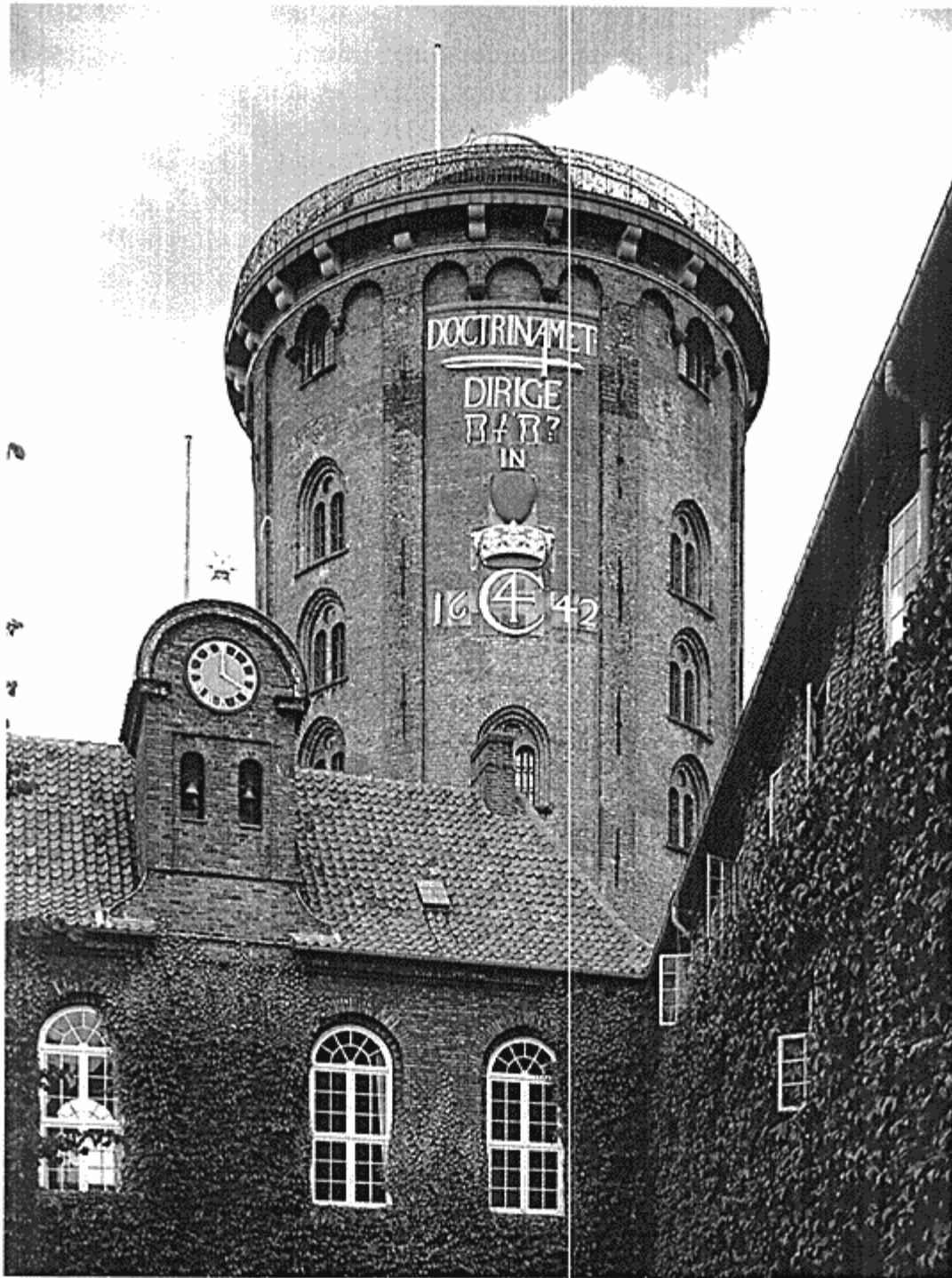
Rundetårn opført af Christian IV mellem 1637 og 1642. På tårnet ses den rebusagtige inskription, som kongen selv havde udtænkt, og som kan oversættes til »Lad Gud styre rettroen og retfærdigen i kong Christian IV's hjerte«. Men også i tårnet som sådan ligger måske en religiøs symbolik: »Herrens navn er et fæstningstårn« hedder det i Ordsprogenes Bog (18,10). (Her gengivet efter Christian IV og Europa , København 1988, planche XXXIX, s. 585).