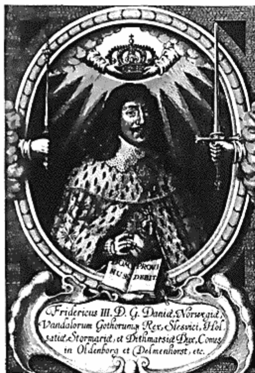
Frederik 3. krones, idet to hænder fra oven sætter kronen ned på hans hoved. Titelblad fra Jesper Brochmands kroningsbeskrivelse, »Den Stormectige Høybaarne Førstis oc Herris Her Friderich dend Tredies ... Kongelige Kroningh«, 1650.

tens opdelt i flere faser ( mandatum , ordinatio , electio og confirmatio ), hvor mandatum og ordinatio tilkom Gud, men hvor der også var plads til et folkeligt element. Ved kroningen i 1648 udtalte Brochmand ikke blot, at Gud kaldte kongerne for guder, men også at Gud havde udvalgt, indsat, salvet og kronet Frederik 3., ligesom den detaljerede udlægning af salvingens betydning understregede den guddommelige handling. Forsiden på Brochmands kroningsbeskrivelse viser et par hænder, der fra himmelen sætter kronen på kongens hoved. Samtidig træder den »folkelige« medvirken frem under kroningsceremonien.