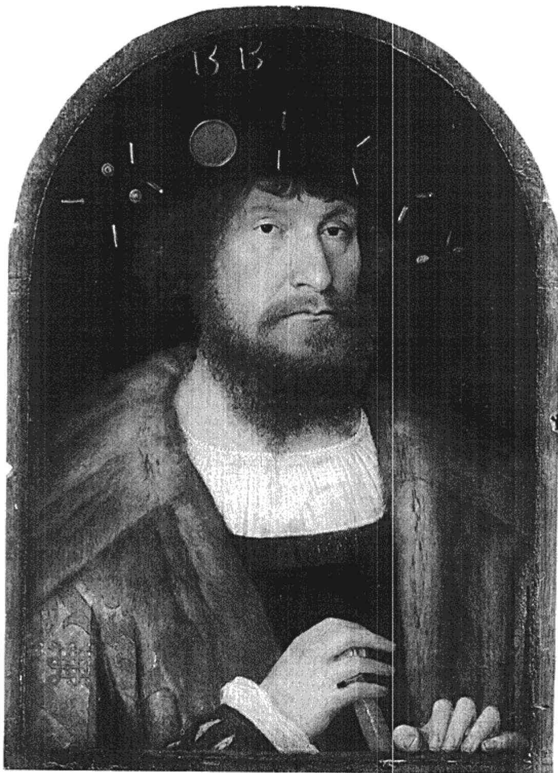
Utsnitt av flamlenderen Michel Sittows portrett av Christian 2. fra 1515. Da var kong Christian 35 år gammel. (Etter: Gyldendal og Politikens Danmarkshistorie, 7, 1989, s. 79).