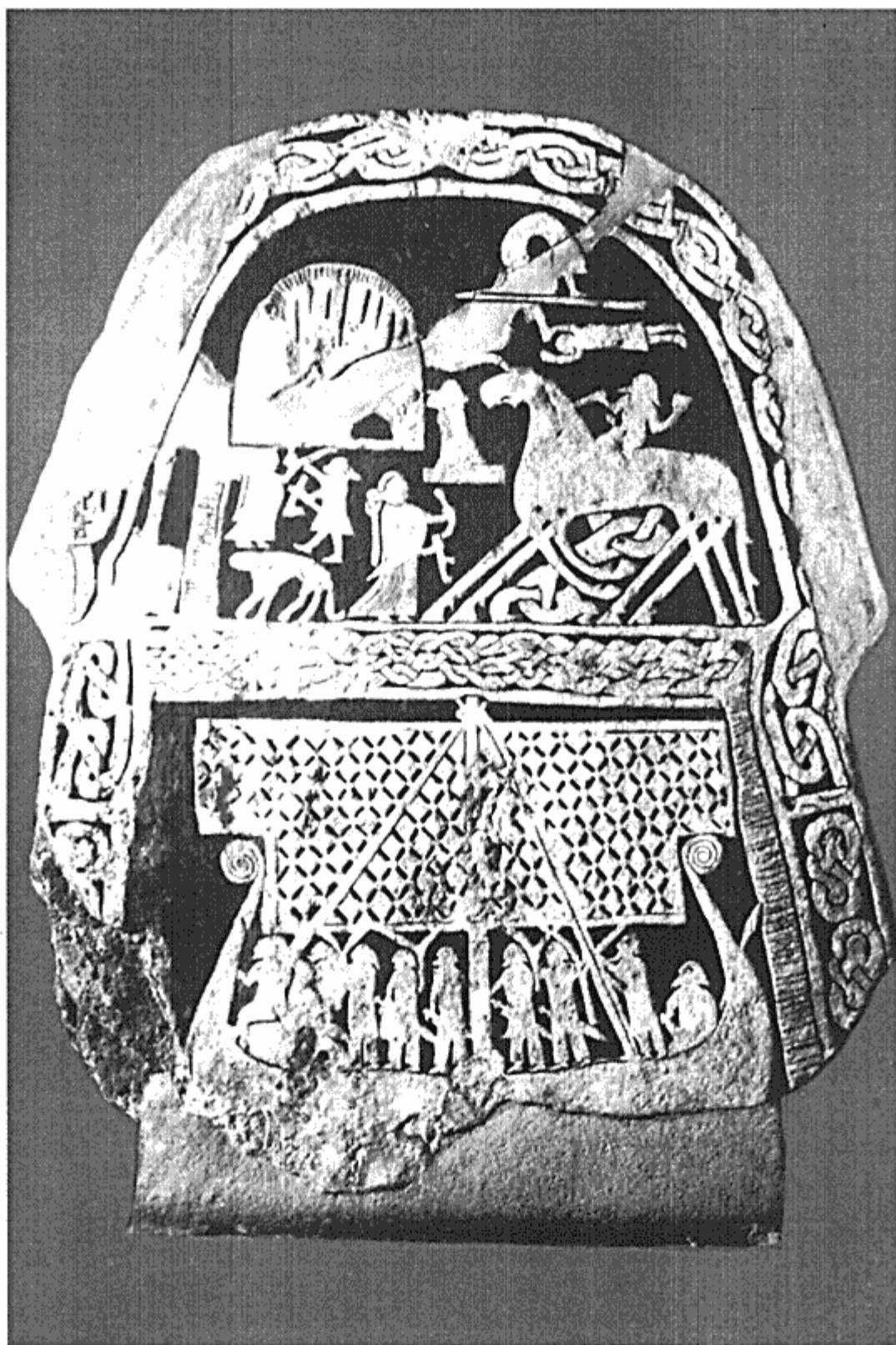
Billedsten fra Gotland. Øverst ses Odin på den ottebenede hest Sleipner. (Efter H.R. Ellis Davidson: Nordens guder og myter, København 1967, fig. 8).