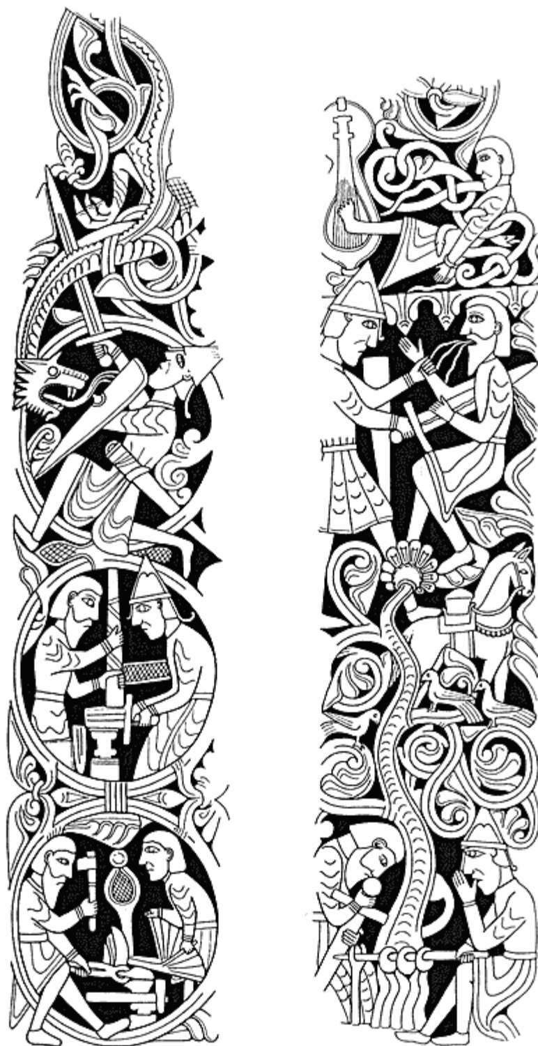
Scener fra fortællingerne om Sigurd Fafnersbane på stavkirken i Hylestad i Norge. Til venstre ses nederst Sigurd i lære hos smeden Regin, i midten Regin ved reparationen af sværdet Gram og øverst Sigurd i færd med at dræbe dragen. Til højre ses nederst Sigurd i færd med at riste Fafners hjerte, i midten Sigurds drab på Regin og øverst den harpespillende Gunnar i ormegården. (Efter Germanen, Hunnen und Awaren. Schätze der Völkerwanderungszeit, Nürnberg 1987, s. 77).