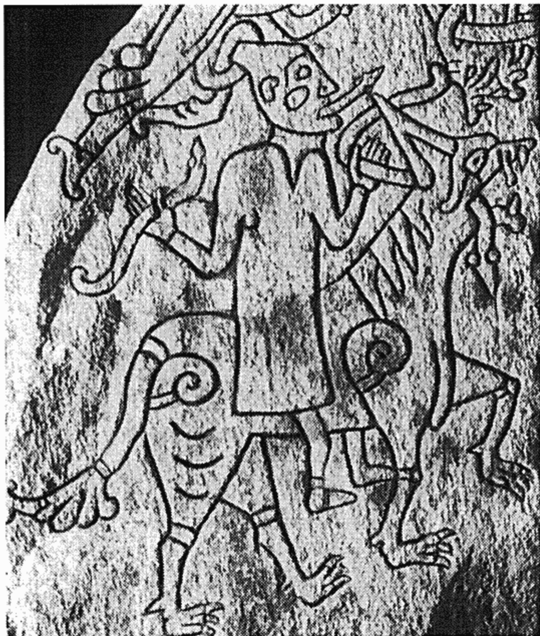
Heksen Hyrokkinn kommer til Balders bålferd ridende på en ulv med en hugorm som tøjle. Runesten fra Hunnestad i Skåne. (Efter H.R. Ellis Davidson: Nordens guder og myter, København 1967, fig. 17).

På Hunnestad-monumentet i Skåne findes et billede af en kvinde, som kommer ridende på et ulvelignende uhyre, idet hun bruger slanger som tømme. I den nordiske mytologi/sagnverden findes kun én dame, som fører sig frem på den måde: jættekvinden Hyrokkinn på vej til Balders begravelse. Runestenen, som er fra ca. år 1000, tillader en identifikation af