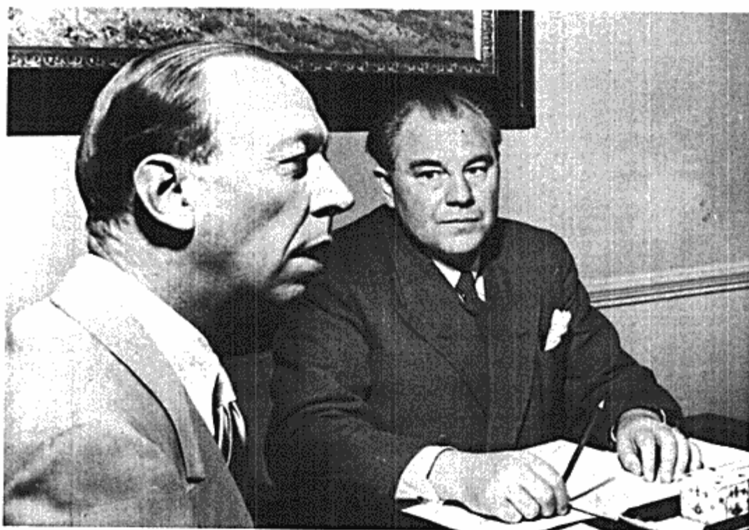
Udenrigsminister Gustav Rasmussen og statsminister Hans Hedtoft var hovedpersonerne på dansk side i det begivenhedsforløb, der førte til, at Danmark og Norge indtrådte i NATO. Det var Gustav Rasmussen, der på Danmarks vegne underskrev Atlantpagten i Washington den 4. april 1949.