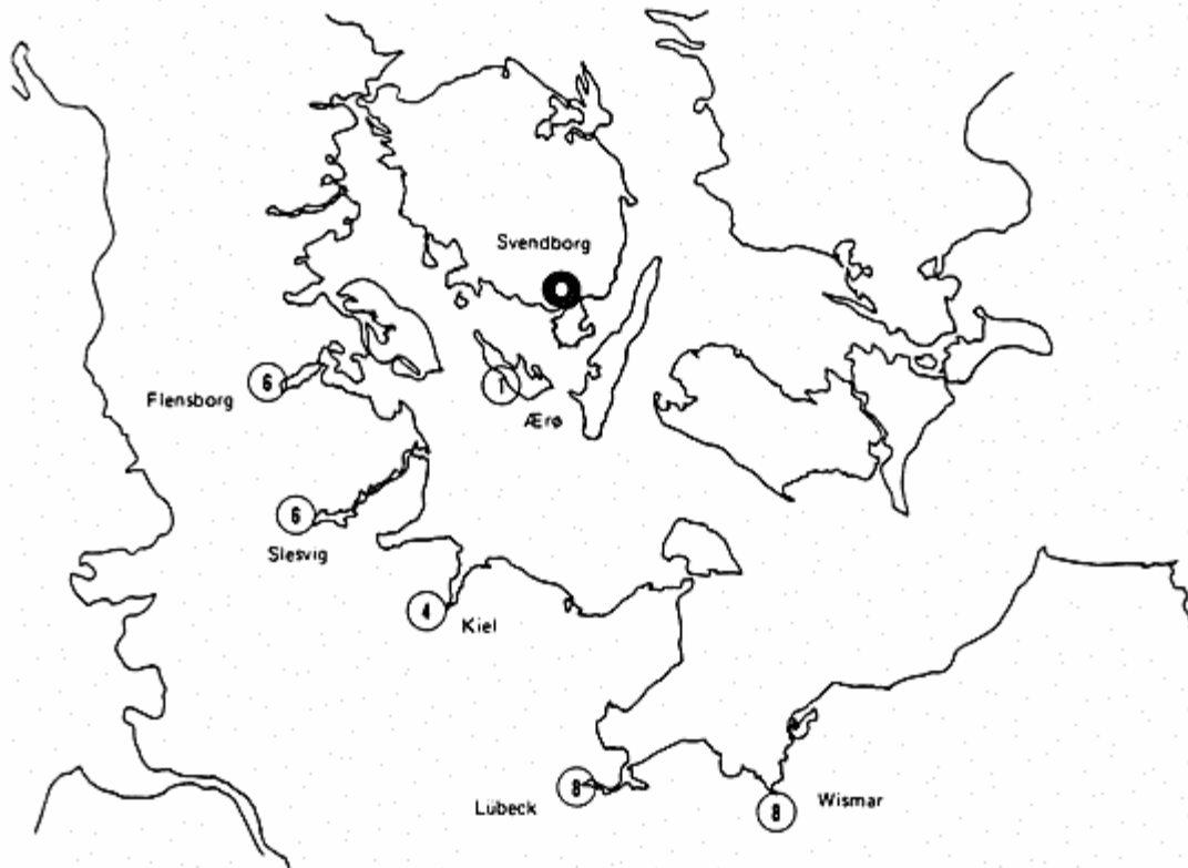
Figur 3. Kort over sejlads på Svendborg 1519-21 ifølge byens toldregnskab.

var en gruppe inden for en mere omfattende bondehandel med korn fra Sydbyn og øerne heromkring. Det er altså handelen herfra, der skal indkredses. Til dette formål kan et bevaret toldregnskab fra Svendborg undersøges.