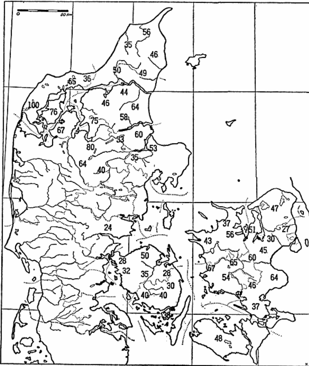
Figur 1. Tallene på kortet angiver egn for egn den procentdel af personer, der er opført på hovedskatmandtallet fra 1660 sammenlignet med folketællingen i 1769 på de samme egne. Tallene er gennemgående beregnet herredsvis, men på grundlag af den ældre herredsinddeling, og i adskillige herreder savnes enkelte sogne. På kortet er en del herreder slået sammen, f. eks. dækker tallet 47 hele Frederiksborg amt med undtagelse af Horns herred, tallet 48 hele Lolland-Falster, tallet 76 hele Mors og tallet 67 alle Sallings fire herreder. Overalt er naturligvis manglende sogne i 1660-materialet også udeladt ved sammenligningen med 1769-tallene. Desuden skal det understreges, at adel og gejstlighed ikke er med i det til grund liggende sammenligningsmateriale fra 1660, men derimod i 1769-tællingen. Når altså den talte bondebefolkning i 1660 er beregnet til en her angivet procent af landbefolkningen i 1769, skal der til 1660-procenten af 1769-tallet lægges en vis, varierende, tildels uberegnelig procent for adel og gejstlighed. Sætter vi den f. eks. på Mors til 10 pct., har altså landbefolkningen her i 1660 udgjort ca. 76 + 7,6 = 83,6 pct. af landbefolkningen på denne ø i 1769. - (Kortet efter Aa. H. Kamp: Arbejdskort over Danmark, 1954.)