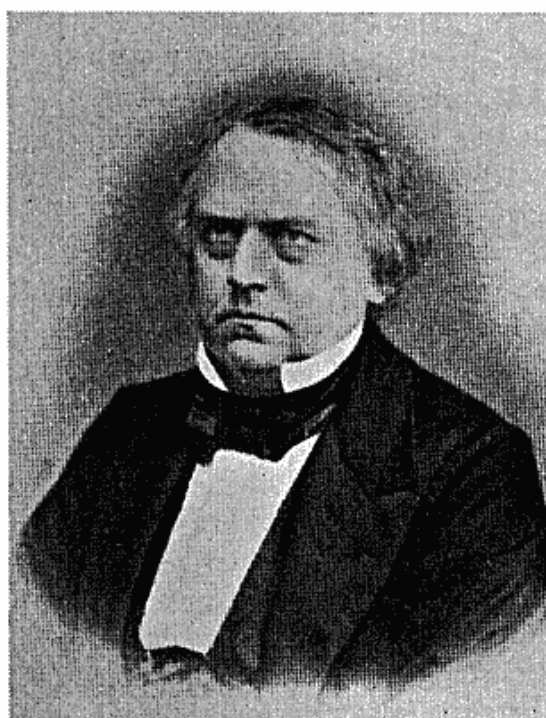
Ditlev Gothard Monrad.

Dette Raisonnement lod sig vel opstille, men det var meget farligt at gjøre gældende. Det viste sig nu ret, hvilke Consequentser Concessionen af 29. Juli medførte: trods alle vore Reservationer var det gaaet over i den almindelige Bevidsthed, at man nu ikke længere kunde forlange yderligere Bidrag af Holsteen end Normalbudgettet uden at man havde