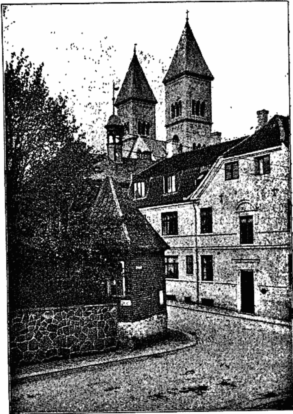
Billede af Lysthuset.

for Tiden bruger det Stykke af Haven, til uskyldig og nødvendig Rekreation«. Sagen kom dog ikke denne Gang i Orden: i al Fald købte Skolen det først i Oktbr. 1830