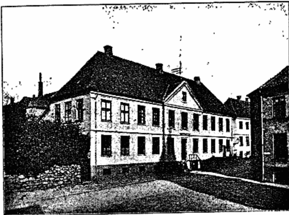
Billede af Katedralskolen i sin nuværende Skikkelse.

I Stueetagen blev de 4 Klasseværelser omregulerede, de nuværende Stuer A, B, C og D; der anbragtes en Gang ud til Mogensgade, hvorfra der blev Indgang til dem alle. — Det uheldigste — navnlig for fremtidige Udvidelser — var derimod Indretningen af Sidebygningen ud mod Nytorvsgyde . Her anbragtes en 5. Klasse