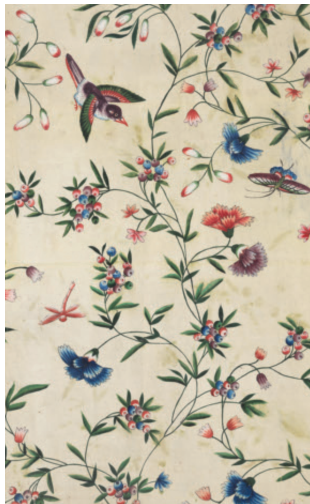
Sommerfugletapetet i tårnværelset blev undersøgt af Nationalmuseets konservatorer, og undersøgelsen viste, at der med stor sandsynlighed er tale om et særdeles kostbart tapet, der var fremstillet og importeret fra Østen i slutningen af 1700-tallet.