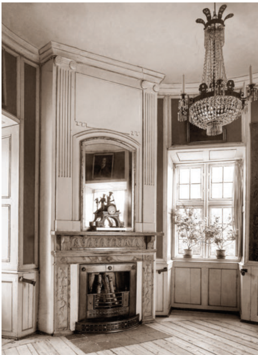
Tårnværelset, som det så ud, da Nationalmuseets konservatorer udførte deres undersøgelser af rummet i 1960'erne med kaminen, panelerne, det malede opspændte lærred og helt til højre i billedet et lille stykke af de ophængte broderede vægtapeter.