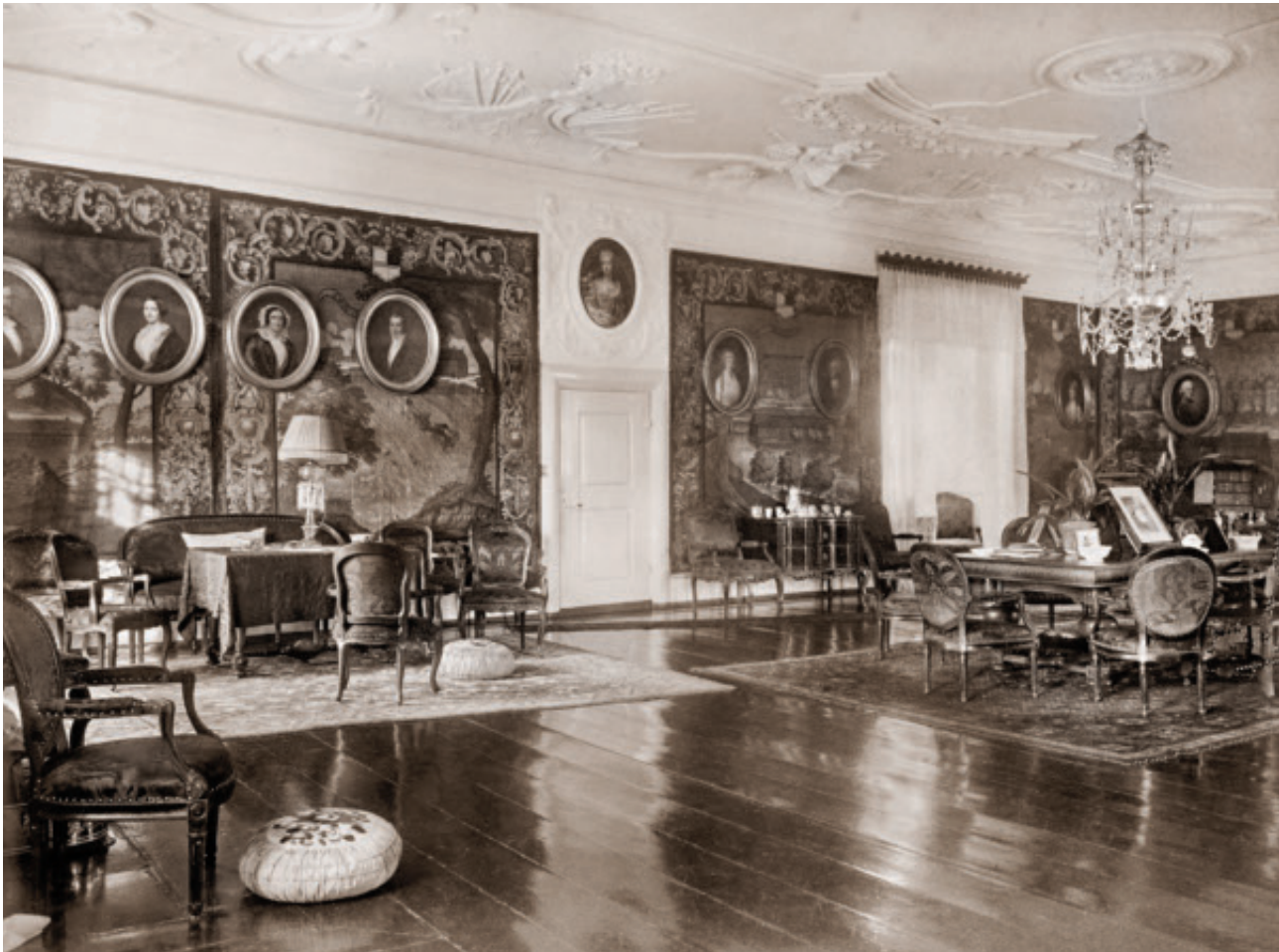
Riddersalen var i 1926 indrettet med langt flere møbler end tidligere, og møblerne var nu kommet ud på gulvet. Man ser også, at slægtsportrætterne er hængt op uden på rummets vævede vægtapeter, hvis motiver er slægtens herregårde i slutningen af 1600-tallet.