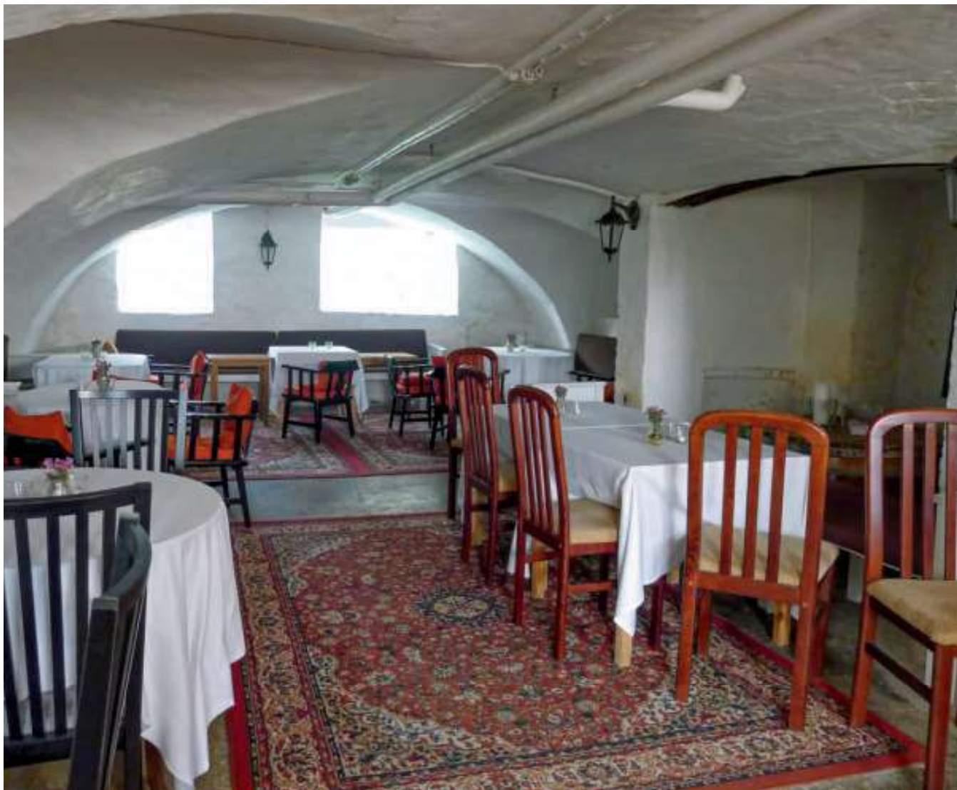
Rummet under det nordre hvælv benyttes ind i mellem til servering fra Brobygårds køkken. Det store åbne ildsted i nordsiden er bundet af renæssancehusets skorsten med en helt traditionel placering midt i en gavl.