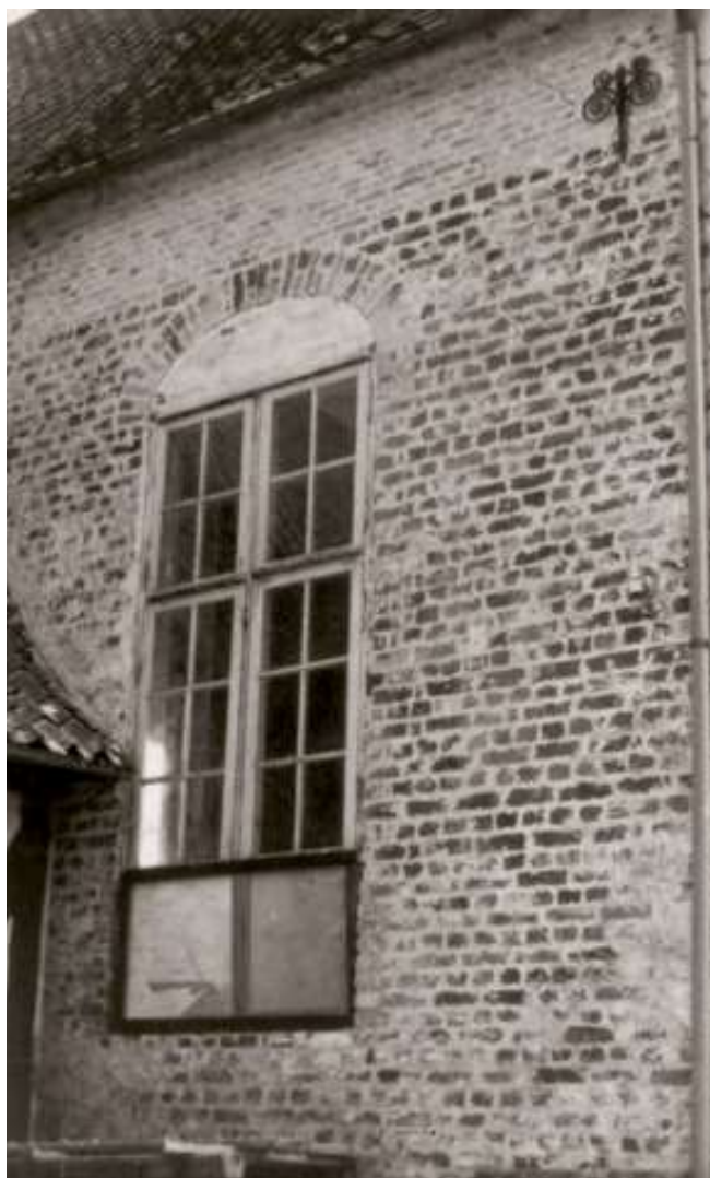
Den afrensede nordgavl i 1967 er den absolut bedst bevarede renæssancevinduesåbning med hele kurvehanksbuen intakt. Den i 1673 ommurede murkrone er også meget tydelig.