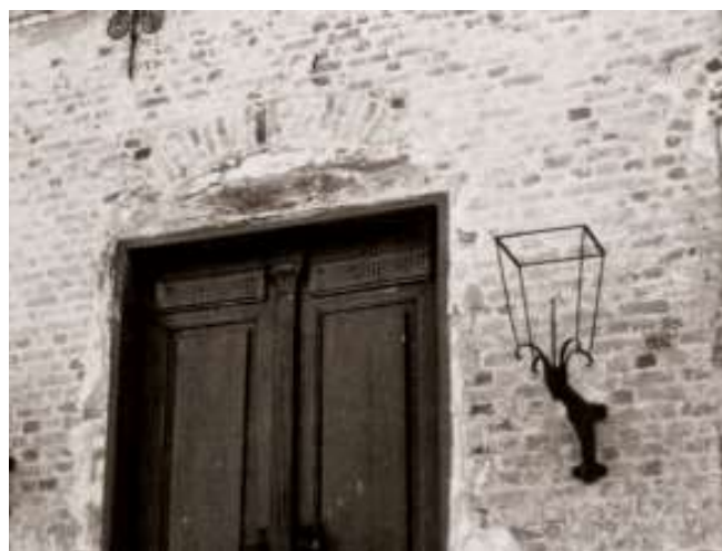
Over hoveddøren ligger en svær bjælke under stikket. Den er lagt ind i 1673, hvor åbningen blev bredere, og det gamle stiks vederlag stort set forsvandt.