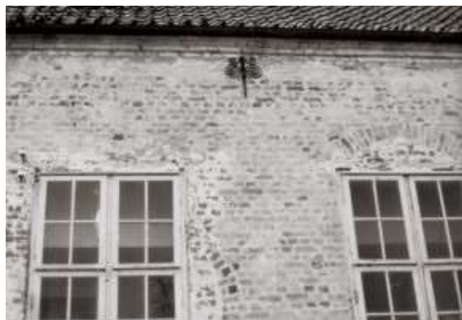
Fjerde (oprindelig dør) og tredje fag på østsiden.