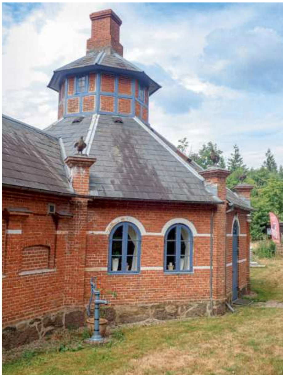
Tranekærs ottekantede lysthus er nok et af landets fineste hønsehuse – August Kleins første værk på Tranekær 1869.