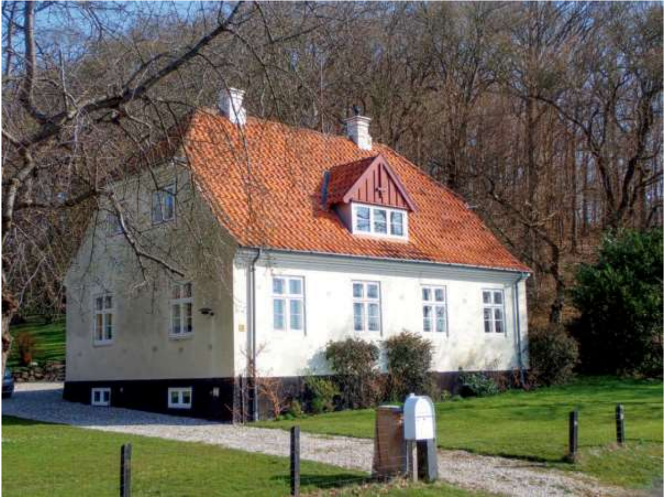
Et af Nyrops fine små "øvrighedshuse" fra årene 1915-19.