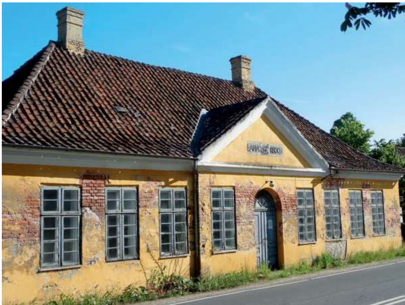
Tranekær skole, opført år 1800 efter tegning af Andreas Kirkerup (1749-1810). Billedet viser desværre også bygningens miserable tilstand.