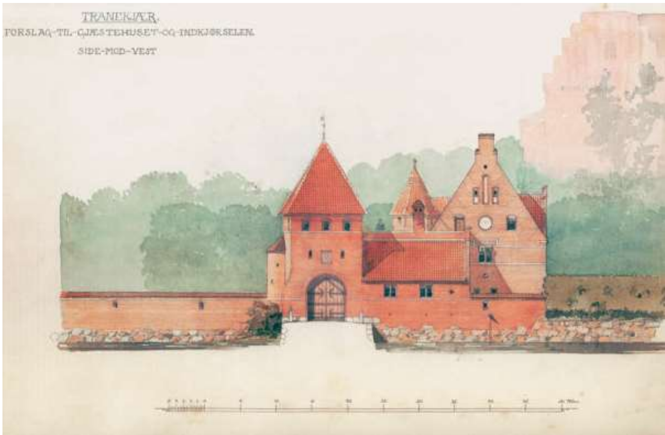
Martin Nyrops (1849-1921) udkast til en ny portbygning med gæstefløj ved Tranekær Slot, 1891. Tegning i privateje.

nyindretning af interiørerne på Broløkke, da den senere lensgreve var flyttet ind på stedet efter sit bryllup i 1863. Her havde han blandt andet tegnet lofter i sin karakteristiske nordiske nationalromantik – og denne romantik fik fuld skrue, da Nyrop i 1891 blev bedt om at tegne et