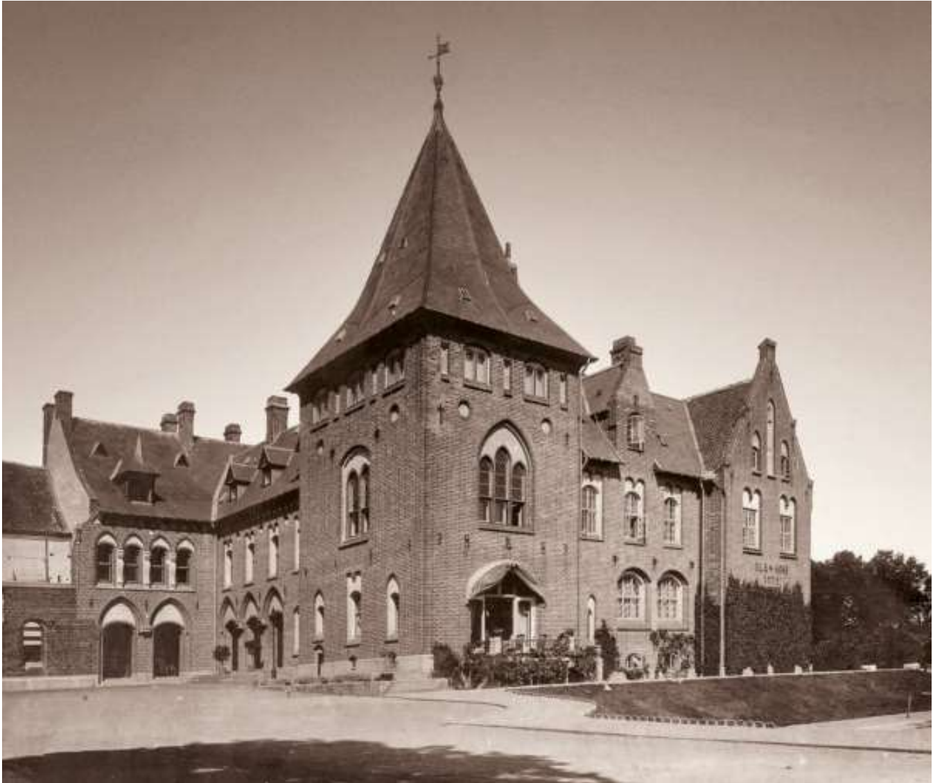
Aalholms sydøstre fløje kort efter opførelsen i 1890'erne. Til venstre i billedet er nordfløjens nye gårdfacade under opbygning. Foto fra omkring 1900 i Antikvarisk-Topografisk Arkiv, Nationalmuseet.