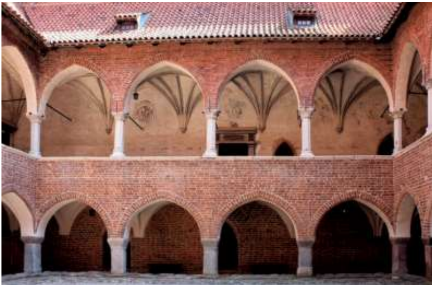
I Heilsberg (Lidzbark Warmiński) er den firfløjede bispeborgs centrale gård ledsaget af korsgange i to etager med spidsbuearkader, båret af svære granitpiller. Foruden at tjene som forbindelsesled mellem de enkelte rum og sale, åbner gangens arkader visuelt det snævre gårdrum. Foto: Dawid Galus, 2013.

kastet. Åbne arkadegange kan med rette være fundet uhensigtsmæssige under hjemlige himmelstrøg, men også referencen til den militante tyske munkeorden kan have ledt til afvisningen. Således fravalgte Holm også en pyntelig mønstermuring, som ellers indgår i det endelige tegningssæt af den ny østre mellemfløj. Tilsvarende rudemønstre med mørkbrændte bindere kan opfattes som noget nær en signatur for Den Tyske Orden, der anvendte den iøjnefaldende dekoration i alle bygningstyper. 16 I Aalholms nygotiske ydre afsendte Holm således kun en diskret reference til ordensstaten via de nymurede blændingsgavle, som blev rejst på den bibeholdte østfløj og det middelalderlige stenhus i herregårdens sydøstre hjørne. Begge gavle blev ledsaget af en lav, glat kam med enkle tinder, der spejlede den gotiske pinakelgavl, der var et populært indslag i det sydøstlige Østersøområde;