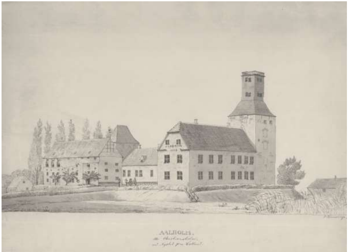
AALHOLEN. St. Charles-les-Bois en 1841 par G. G. G.