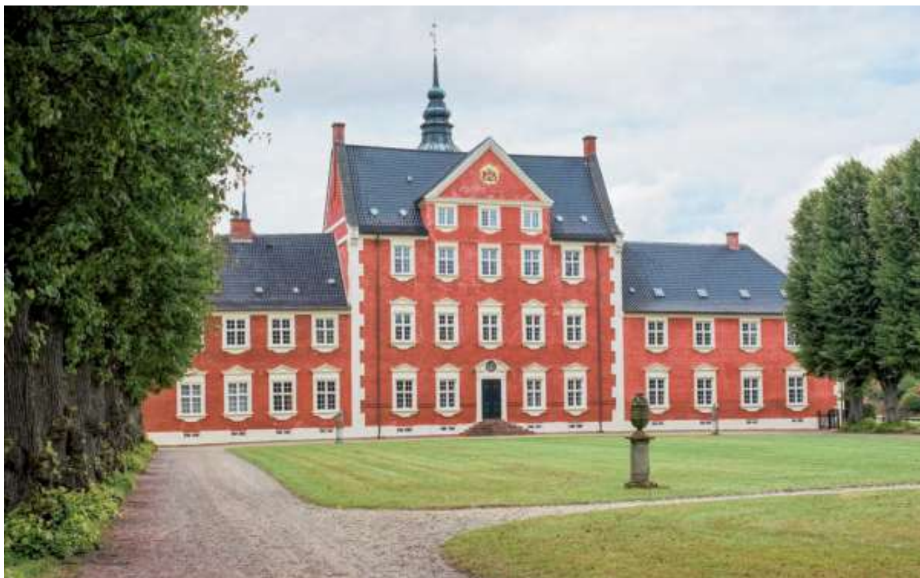
Nordfløjen i Jægerspris Slot set fra parken. Det forhøjede parti repræsenterer et middelalderligt stenhus, men gentagne ombygninger gør det hverken muligt at præcisere udformning eller datering. For Hans J. Holm må det også først og fremmest have været fløjens overordnede struktur, der blev fundet interessant. Foto: Thomas Bertelsen, 2022.

1900. Intet taler for, at ombygningen blev økonomisk trængt, eller at der opstod uoverensstemmelser mellem arkitekt og bygherre, som ellers har lagt mange byggeprojekter i graven. At Holm i 1898 fik overdraget opførelsen af et nyt kongeligt bibliotek, der skulle blive hans hoved-