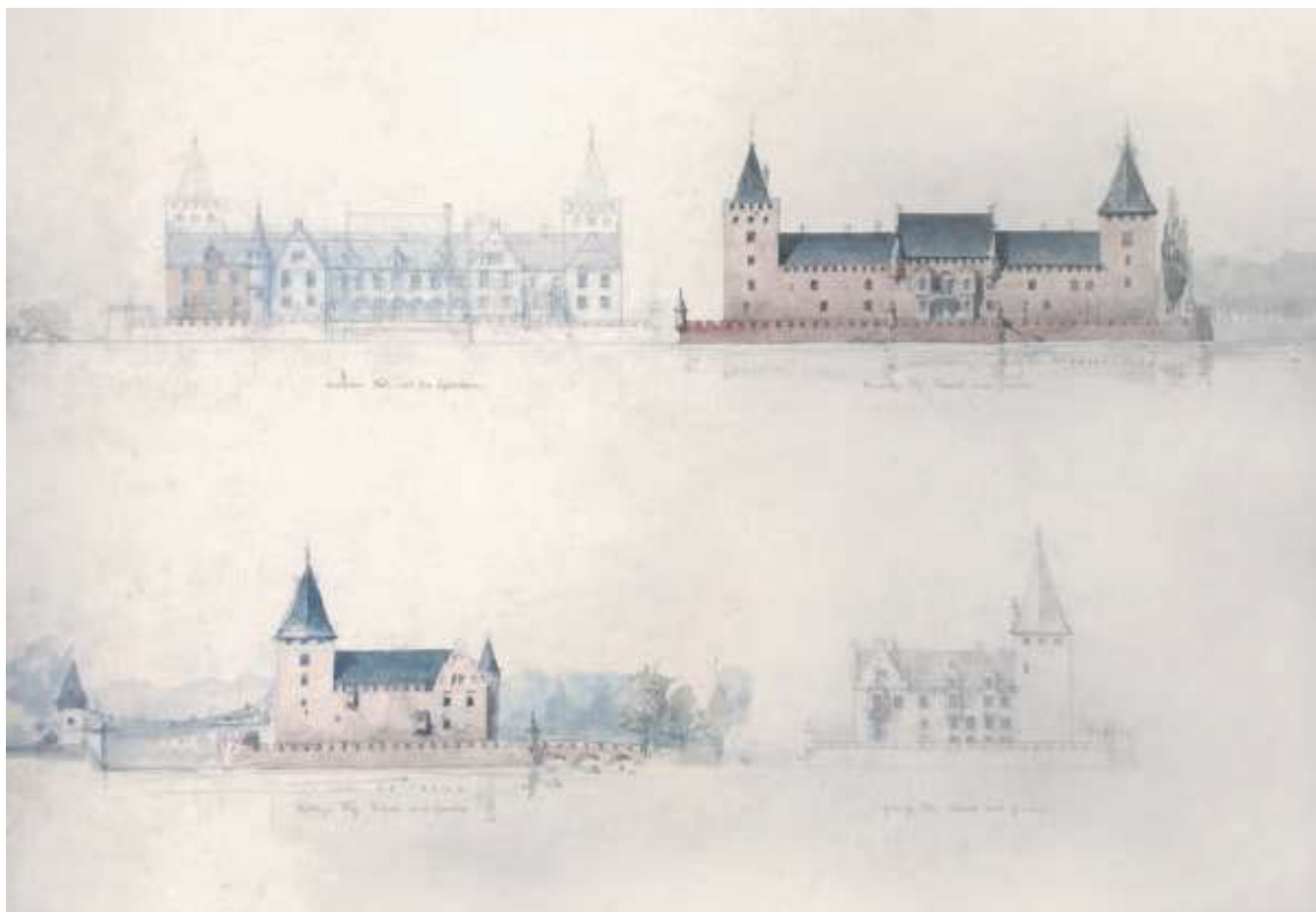
Forslag til ombygning af Aalholm som romantisk ridderborg. Med dramatisk håndkolorering understøttes effektivt fortællingen om et ældgammelt anlæg fra den mørke middelalder. I den løse streg antydes dog også, at projektet næppe kom langt. Udateret tegning af Hans J. Holm, Det Kongelige Bibliotek.

samlet omkring en gård med ledsagende åben korsgang, der gerne blev ført over flere etager. I én fløj var kapellet indrettet, mens de øvrige dannede den faste ramme om